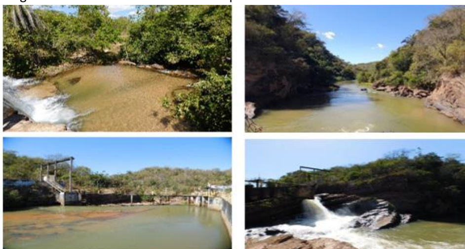
Figura 2 -Recursos Hídricos no município de Poxoréo -MT

Quanto a essa percepção temos abaixo a figura 2, que demonstra essa primeira natureza.