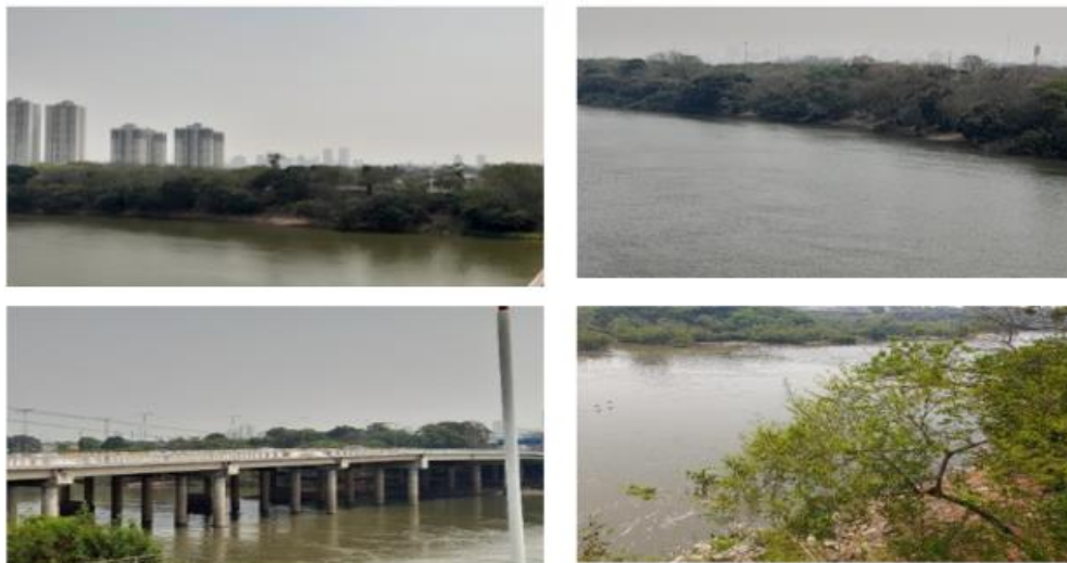
Figura 3 – Região de localização das duas maiores cidades do Estado de Mato Grosso

O natural alterado pelo homem em muitos aspectos é visível tanto na biosfera quanto na atmosfera, conforme podemos constatar na figura 3, retirada sobre a ponte que divide os dois maiores aglomerados urbanos de Mato Grosso, que estão representadas pelas cidades de Várzea Grande e Cuiabá. Essas imagens são do mês de setembro de 2022, demonstrando os efeitos das queimadas cobrindo a área.