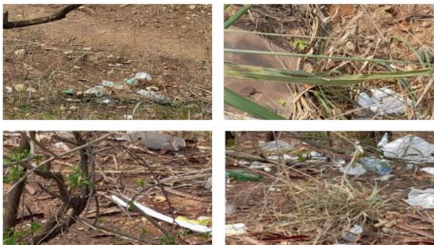
Figura 4 Imagem da margem esquerda do Rio Cuiabá com resíduos sólidos