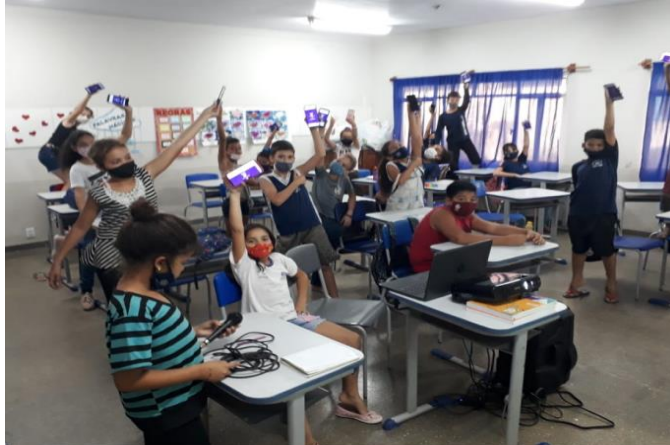
Figura 2 – Estudantes do 4º ano no momento do quizz com o kahoot

Fonte: Dados coletados durante a experiência (2021).