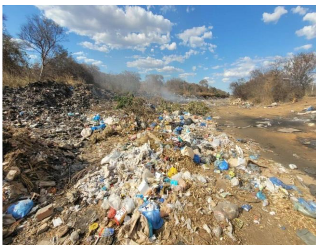
Figura 3- Lixão do Distrito de Julião

Porém o problema não foi solucionado, o descarte de resíduos sólidos de Malhada, foi transferido para o vazadouro a céu aberto, localizado próximo a BR 030, no Distrito de Julião, num local situado a 3 km da Lagoa do Mocambo, na direção das vicinais que ligam as Comunidade da Ressaca e Ilha das Melancias, a 5 km do Rio São Francisco.