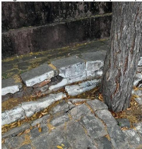
Figura 3: Patologia sobre via de passeio (calçada quebrada)-Cajazeiras-PB

Outro dado abordado em diversas pesquisas é a falta de manutenção da vegetação arbórea nas vias públicas, o que pode ocasionar diversos prejuízos, como a invasão das copas das árvores sobre placas e sinais de trânsito, postes de luz, fiação elétrica, acidentes com pedestres e usuários de meios de transporte, além de invasão em imóveis. A poda é uma ação indispensável para o desenvolvimento de uma árvore, assim como para o planejamento urbano. Primeiramente, é necessário o aval prévio da secretaria ou órgão responsável do município. Caso haja algum manejo indevido, o responsável responderá por crimes ambientais (TEIXEIRA, 2021).