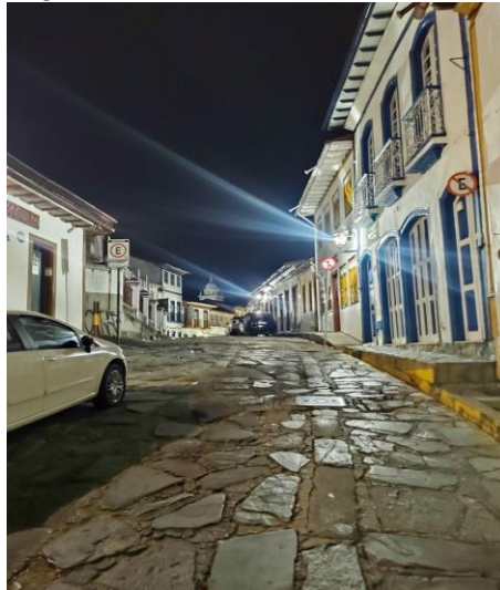
Figura 4 - Rua de do Carmo durante a noite

coloridas, além dos telhados alaranjados (Figura 4). O contorno das residências ao olhar para o céu, devido ao gabarito baixo, proporcionava uma visão ampla, contando inclusive com estrelas, raras de se ver em cidades grandes, como Juiz de Fora, devido à grande quantidade de luzes artificiais ligadas.