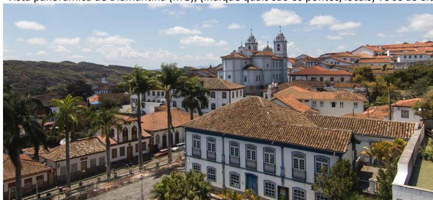
Figura 2 – Vista panorâmica de Diamantina (MG), (indique quais são os pontos/locais) vê se ao alto a Igreja XXXX