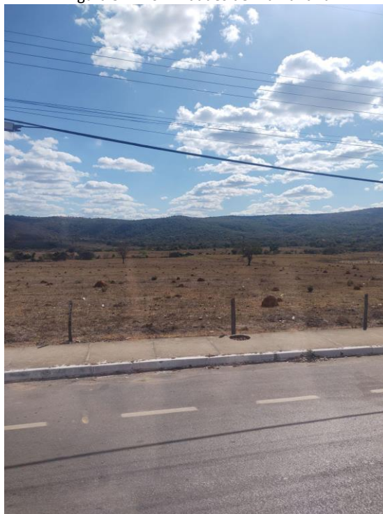
Figura 3 – Proximidades de Diamantina

riqueza de paisagens, mesmo diante da velocidade imposta pelo veículo, que faz com que não dê para reparar em detalhes. Apenas naqueles capturados em foto. Uma paisagem rochosa e com vegetação rasteira anuncia que Diamantina está cada vez mais próxima (Figura 3). Até, de fato, chegar na cidade.