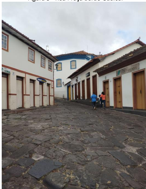
Figura 5 - Rua Praça Barão Guaicui

Já de dia, vê-se com clareza as edificações, mesmo as mais distantes, com fachadas brancas ornadas de cores vibrantes, tanto nas residências quanto nas igrejas (Figura 5). O amplo céu azul, com algumas nuvens brancas, dialoga com as construções brancas com partes azuis, com o laranja se destacando no topo: quer seja o sol, quer seja os telhados. E o convite deste céu a olhar para cima, resulta também na oportunidade de apreciar os beirais das edificações, pequenos, muitas vezes discretos, mas ricos em detalhes, delicados e predominantemente bem conservados.