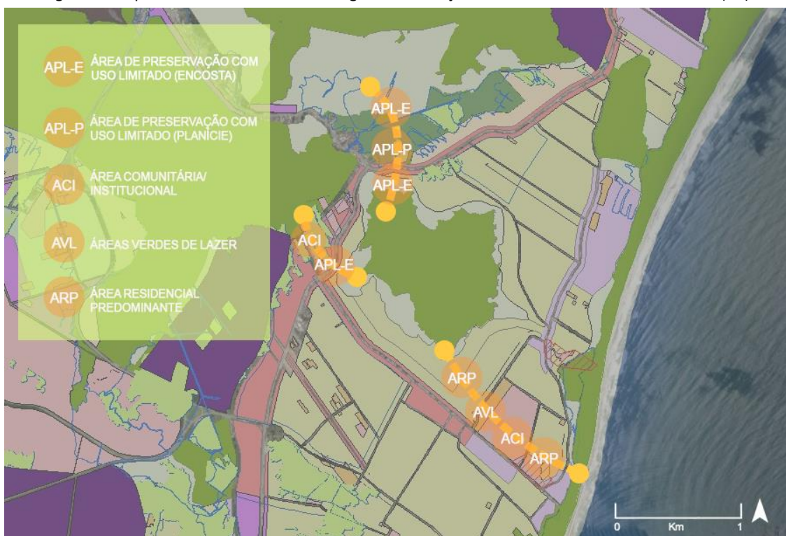
Figura 2 - Proposta dos três corredores ecológicos e correlação com zoneamentos do Plano Diretor (PD).

recuperação ambiental. Caso o particular proprietário do imóvel com APP não tenha interesse em restabelecer a área em seu estado natural, o poder público estará autorizado a promover a desapropriação do imóvel. Caso seja necessária alguma indenização, sugere-se que os pagamentos sejam custeados por valores provenientes do aluguel dos espaços públicos da UC, como os das torres de comunicação do topo do morro, os das infraestruturas de distribuição de energia elétrica e de captação de água potável no local, além de doações e de recursos próprios da municipalidade.