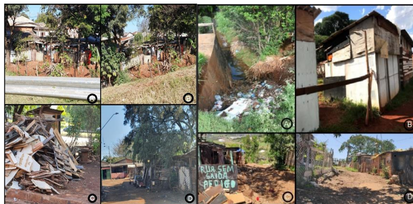
Figura 3 – Territórios vulneráveis – Londrina