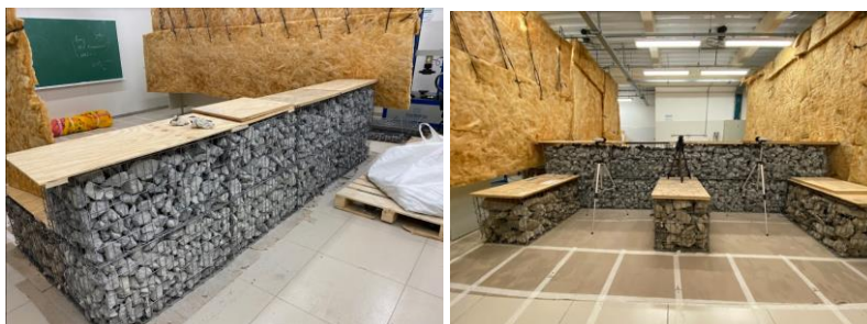
Figura 4 - Elementos de gabiões já finalizados – parte frontal e posterior.