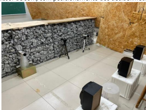
Figura 6 - Disposição do emissor de som, com posicionamento dos decibelímetros frente a barreira acústica