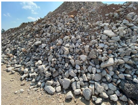
Figura 1 - Pilha de resíduos sólidos de demolição de construção