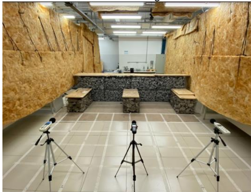
Figura 2 - Isolamento acústico posicionado nas faces laterais do gabião até a extremidade final do laboratório.