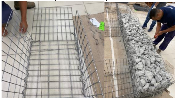
Figura 3 - Formato gabião tipo caixa modelo Easys, conexões facilmente montadas com arames espiral e tirantes de travamentos para melhor enrijecimento das caixas.