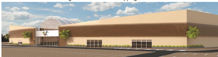
Figura 3 – TCC – Vale Shopping Cruzeiro

O projeto do Vale Shopping Cruzeiro, aspirou valorizar o terreno, na cidade de Cruzeiro, em São Paulo. Na busca pela eficiência energética da edificação, foram empregados recursos, tais como o uso de postes com receptores solares que permitem que a iluminação do estacionamento, reduzindo a dependência da rede elétrica convencional. Da mesma forma, a iluminação interna é alimentada por placas solares gerando sua própria energia para iluminar seus espaços internos, notou-se nesse item o cálculo de dimensionamento que resultou em cerca de 205 placas de capacidade de 7,71A. Além disso, a inserção de claraboias em pontos específicos e shafts para iluminação zenital permite o aproveitamento máximo da luz natural, reduzindo a necessidade de iluminação artificial durante o dia. A aplicação desses recursos ajuda a aumentar a autonomia energética da construção, tornando-a mais sustentável e eficiente do ponto de vista energético.