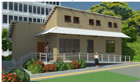
Figura 9 – TCC – Protótipo para Habitação Eco-sustentável de Interesse Social

ambiental, atendendo às necessidades das famílias de baixa renda de forma acessível. Além disso, o projeto buscou incentivar o interesse dos estudantes por processos sustentáveis na habitação, envolvendo-os no desenvolvimento e implementação das soluções sustentáveis.