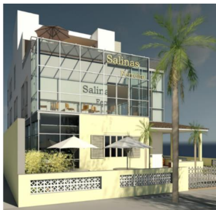
Figura 5 – TCC – Pousada e Restaurante Salinas Ferreira