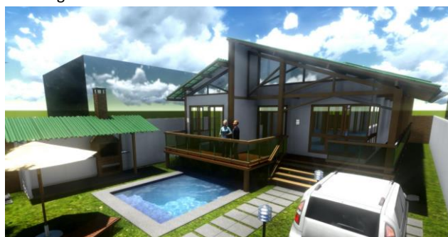
Figura 7 – TCC – Residência Sustentável em Araruama

O projeto da Residência Sustentável em Araruama, Rio de Janeiro, demonstra uma adequação dos modos de habitar por meio do interesse na elaboração de um programa de necessidades bem definido junto ao morador/investidor e aplicação diversas medidas sustentáveis. A escolha da localização levou em consideração e a proximidade com serviços e áreas urbanas, o que contribui para a redução de deslocamentos e o aproveitamento de infraestruturas existentes. O objetivo geral do projeto foi proporcionar conforto aos moradores, reduzir os custos de manutenção e promover o uso consciente dos recursos naturais, demonstrando um modelo de habitação mais sustentável possível.