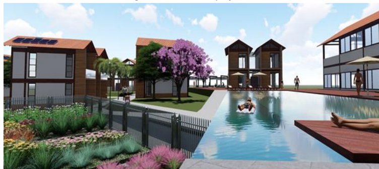
Figura 2 – TCC - Espaço Gaia

O projeto do espaço Gaia, proposto para São Pedro da Serra, Nova Friburgo, no Rio de Janeiro, foi concebido para uma propriedade rural com uma distribuição racional do programa de necessidades. O projeto inclui um Casarão (sede), oito chalés para hospedagem e um chalé sauna. A implantação do projeto foi adaptada às curvas de nível do terreno, buscando uma utilização racional do espaço disponível e evitando desnivelamentos excessivos. Uma das premissas do projeto foi proteger o solo das chuvas diretas nas partes mais altas do terreno, considerando que o solo da região é fino evitando possíveis deslizamentos. A inserção de espécies vegetais foi planejada que formam uma cobertura densa com raízes finas, promovendo um melhor adensamento do solo.