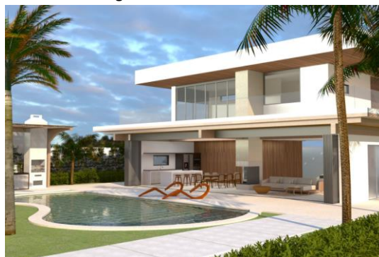
Figura 8 – TCC – Casa Brisa

O projeto da Casa Brisa em Arraial do Cabo, Rio de Janeiro, propôs uma arquitetura residencial unifamiliar de alto padrão, utilizando conceitos do regionalismo crítico, otimização de recursos arquitetônicos e preservação das características naturais da região. No projeto foi enfatizada a integração dos ambientes internos com o espaço externo. Dentre os materiais modulares empregados estão os painéis de CLT ( Cross-Laminated Timber ) desempenham um papel importante na construção, pois são versáteis e permitem a criação de edifícios para diversos usos, além de permitir modificações quando necessárias. Eles podem ser combinados com outros materiais construtivos, como estruturas metálicas e de concreto, oferecendo flexibilidade e liberdade de design arquitetônico.