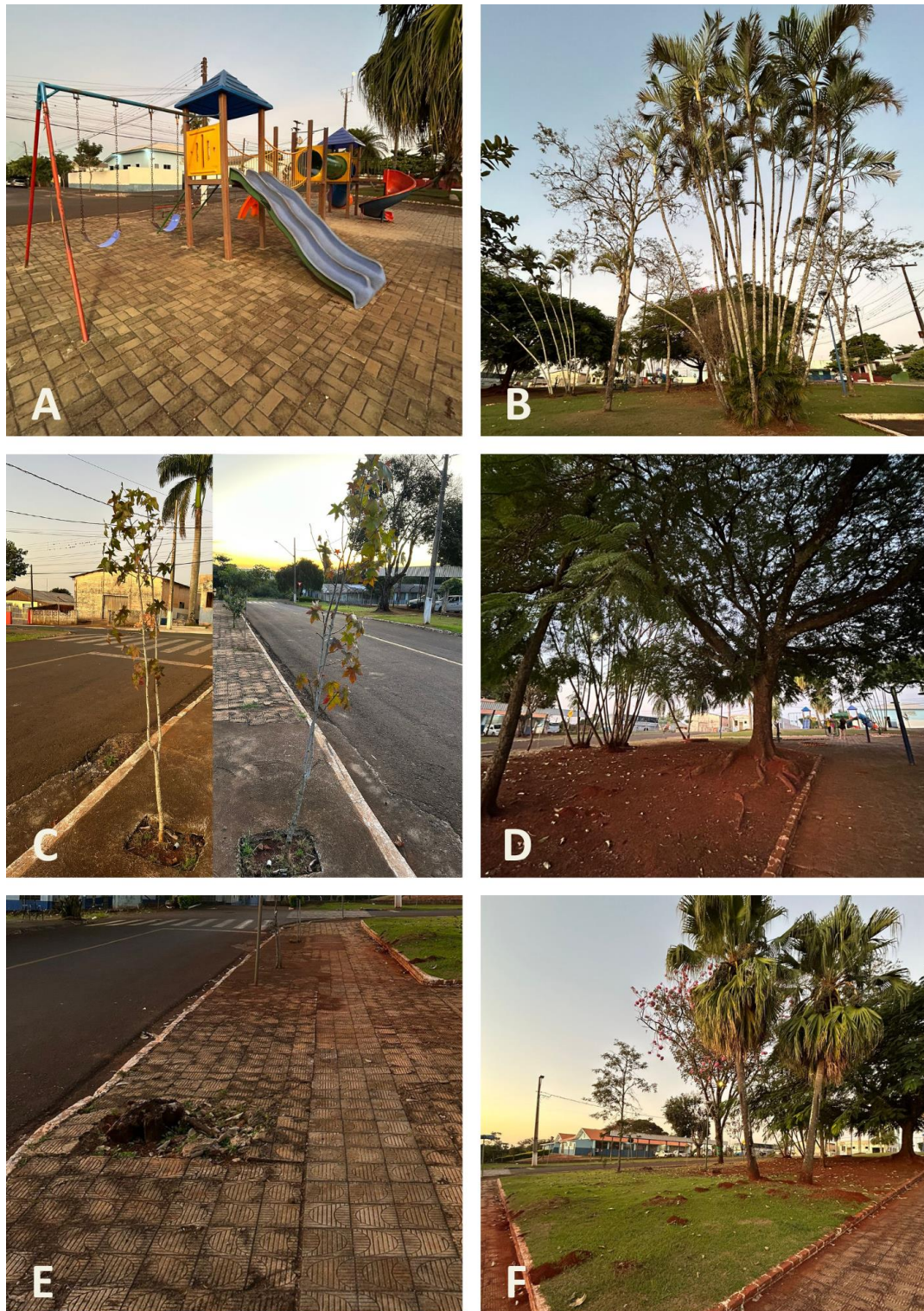
Figura 3 – Características da praça Fridolin Barbist

Recebeu conceito regular, pois está distante da centralidade da área urbana, privilegiando principalmente os moradores que vivem no bairro Jardim Itapuã, ao entorno da praça. No entanto, também foi considerado na análise qualitativa, que a praça faz está próxima das áreas residenciais, favorecendo o uso do local pela população que é de fácil acesso.