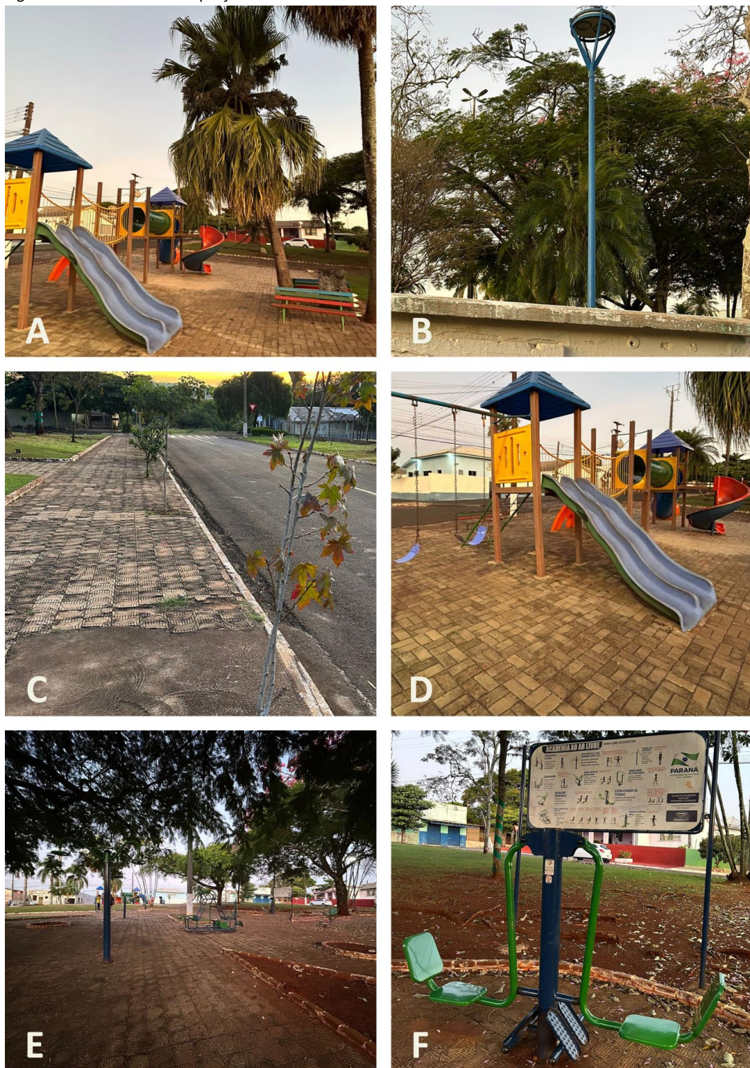
Figura 2 – Características da praça Fridolin Barbist

Existe apenas uma iluminação alta (acima da copa das árvores), que está localizada no centro da praça. Por outro lado, as luminárias baixas (abaixo das copas das árvores), que totalizam 5, estão distribuídas por toda a área (Figura 2-B). Estas luminárias são compostas por luzes de Light Emitting Diode (LED) e nem todas as luzes estão funcionando corretamente.