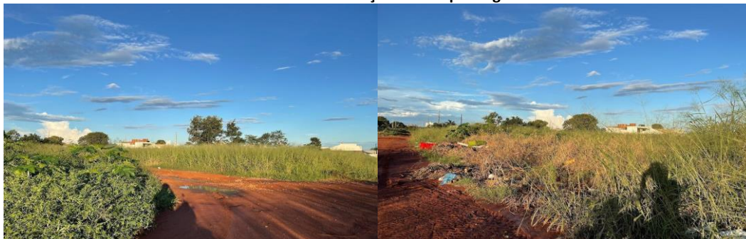
Foto 3 e 4 - Terrenos ociosos sem a devida manutenção no Parque Sagrada Família.