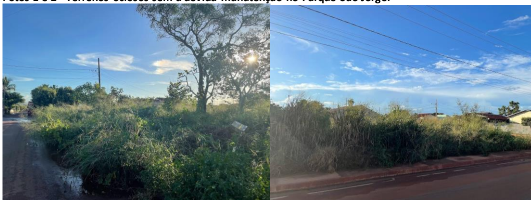
Fotos 1 e 2 - Terrenos ociosos sem a devida manutenção no Parque São Jorge.