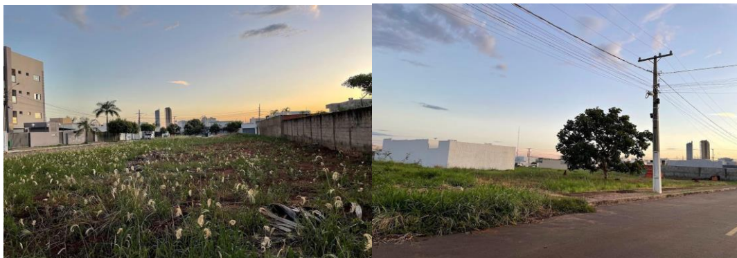
Foto 7 e 8 - Áreas ociosas nos bairros Granville I e II e Sunflower.