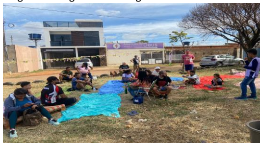
Figura 3 - Registros de imagens do evento sociocultural