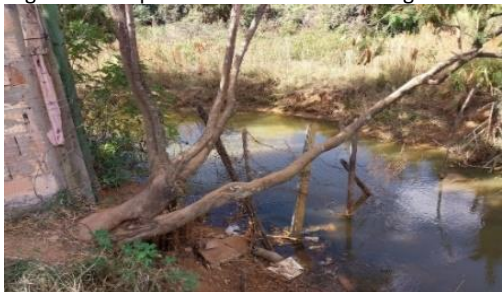
Figuras 2 - Impacto socioambiental na Lagoinha

Além disso, artistas locais foram convidados a realizar intervenções artísticas no local, utilizando técnicas e materiais sustentáveis, com o intuito de transformar a área da Lagoinha em um espaço mais atrativo e inspirador. Essas intervenções artísticas foram feitas em colaboração com a comunidade, estimulando o sentimento de pertencimento e empoderamento dos moradores locais. Ao longo do dia, também foram promovidas palestras e rodas de conversa com especialistas em meio ambiente, que abordaram temas como conservação da fauna e flora, gestão de resíduos, preservação dos recursos hídricos, entre outros. Essas atividades tiveram como objetivo fornecer informações relevantes para que os participantes pudessem compreender melhor os desafios ambientais enfrentados na região e quais ações podem ser adotadas para promover mudanças positiva. O evento fortalece as ações da comissão, quando há o envolvimento sociocultural, em uma unidade de conservação degradada de grande vulnerabilidade socioambiental conforme pode ser visto nas Figuras 2 e 3.