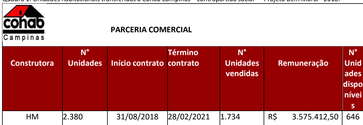
Quadro 1: Unidades habitacionais transferidas à Cohab Campinas – contrapartida social - “Projeto Bem Morar” 2018.

Um exemplo profícuo de aplicação desta política habitacional é o empreendimento habitacional “Projeto Bem Morar” da construtora HM Engenharia, o qual foi implantado em 2018 na região do Distrito Ouro Verde, do município campineiro. Por meio da celebração de parceria com a COHAB/CP sob o império da LC n. 184/17, foi possível a disponibilização de seu Cadastro de Interessados em Moradia (CIM), o qual compreende as famílias de renda mais baixa renda da cidade, para atendimento da demanda deste empreendimento de interesse social, reduzindo, assim, o déficit habitacional voltado à população vulnerável e hipossuficiente, conforme se comprova dos dados oficiais obtidos junto à Companhia.