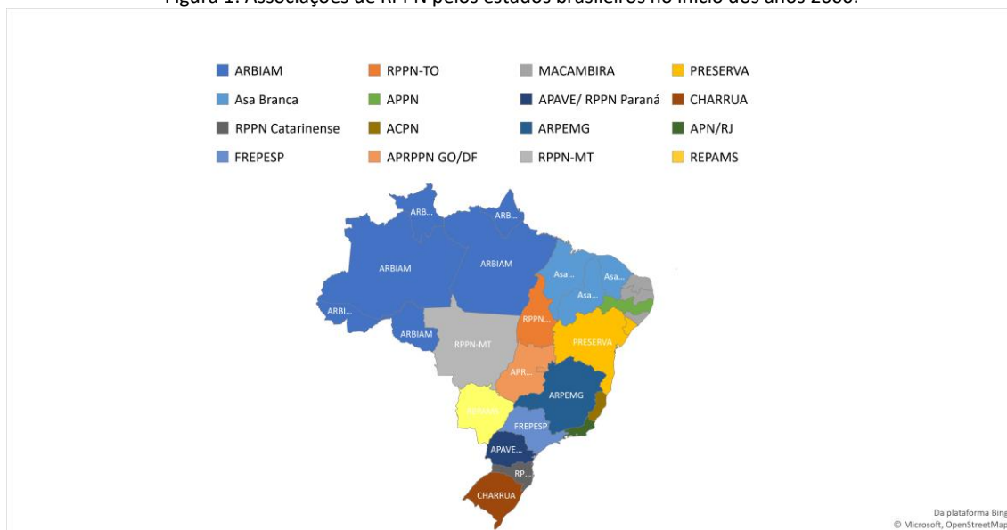
Figura 1: Associações de RPPN pelos estados brasileiros no início dos anos 2000.