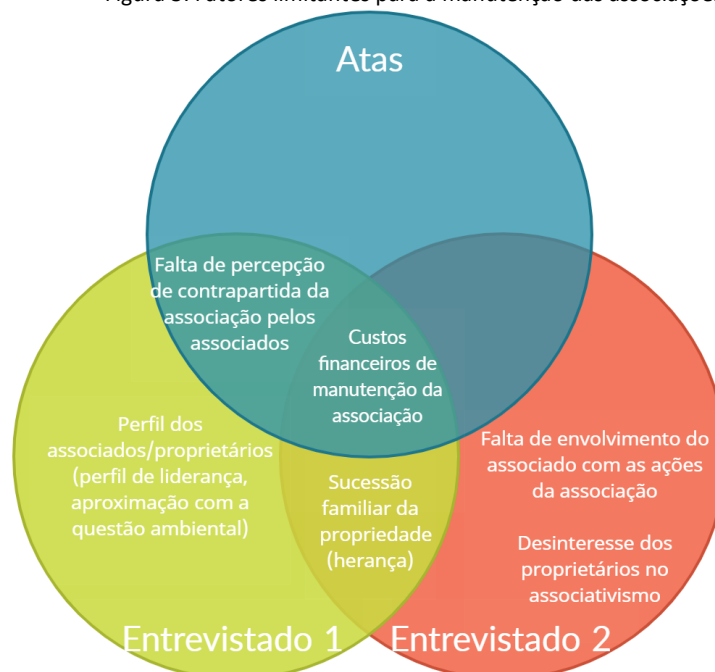
Figura 3: Fatores limitantes para a manutenção das associações.