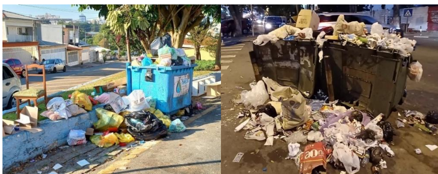
Figura 2 - São Caetano do Sul, SP, Brasil (à esquerda), e Luanda, capital da Angola (à direita): duas localidades e desafios semelhantes no manejo e gestão de RSU, 2023.

Pôde-se contatar com essa pesquisa que, apesar de São Caetano do Sul, SP, Brasil, e Luanda, capital de Angola, serem distintas em relação a alguns indicadores e dados sociodemográficos e geográficos, enfrentam determinadas problemáticas semelhantes, mesmo que em escalas diferentes, no manejo e gestão de resíduos sólidos urbanos, conforme figura 2, a seguir.