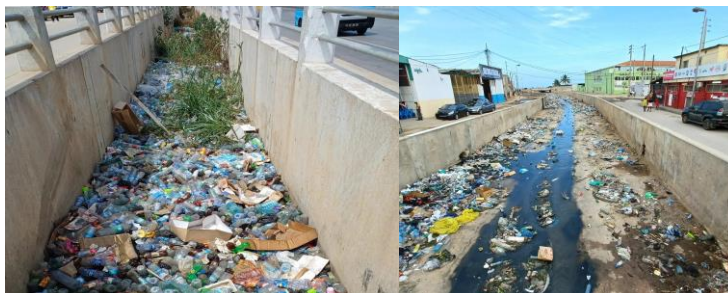
Figura 1 - Valas com RSU na região do Samba, distrito de Luanda (capital) de Angola, 2023.