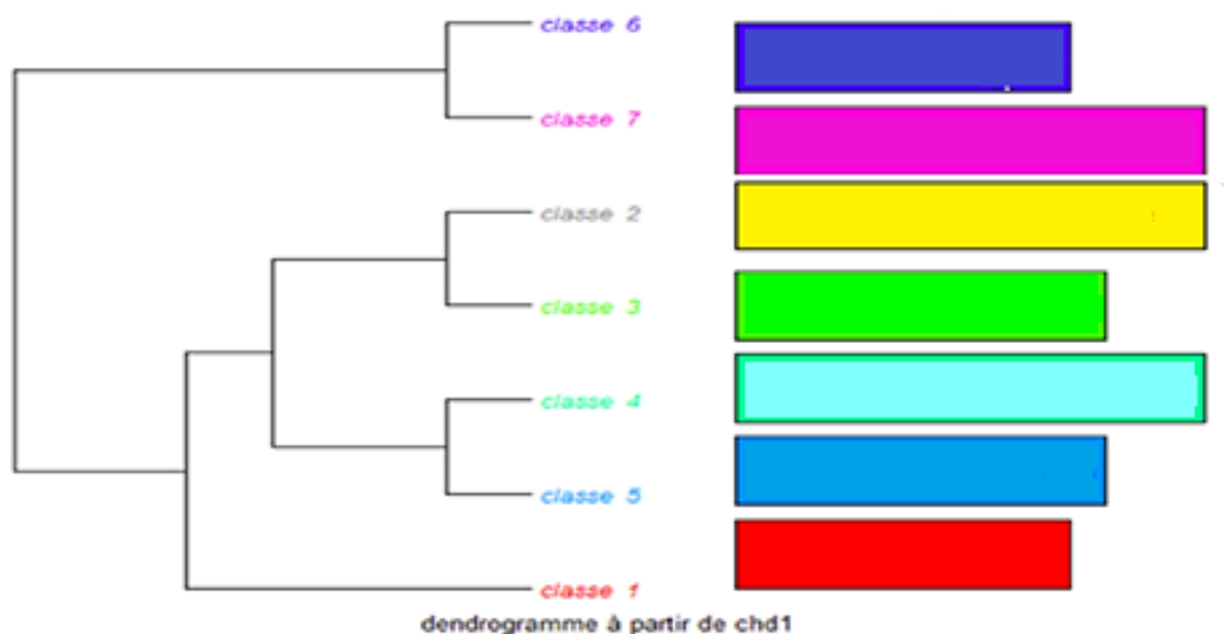
Figura 3. Dendograma dos artigos Nacionais

Assim, a análise da classificação hierárquica descendente (Figura. 5) apesar do pequeno número de artigos, nos revela as características das publicações científicas corroborando os achados na nuvem de palavras e análise de similitude. Os 2 grupos de modo geral tratam de questões relacionadas à gestão de resíduos vinculados aos processos de coleta e os desafios propostos pelos municípios especificamente na região do Pontal do Paranapanema e Parque Estadual Morro do Diabo.