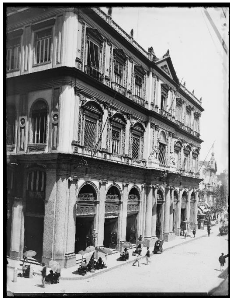
Figura 1-Correios - Rua 1º de Março-Rio de Janeiro RJ

Fonte: Acervo Instituto Moreira Salles – Marc Ferrez/Coleção Gilberto Ferres (cerca de 1885) - //acervos.ims.com.br/portals/#/detailpage/102572 – acessado em 17 de julho de 2023