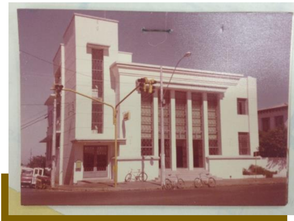
Figura 8 – APT Marília - Tipo Especial IX

Este conjunto de esquadrias era protegido por uma estreita marquise. O coroamento deste bloco central era uma cornija de larguras e avanços diversos. Em algumas construções, acima desta estrutura eram instaladas letras metálicas como nome 'CORREIOS E TELÉGRAFOS'. Com forte influência da arquitetura fascista bastante difundida na Itália (PEREIRA, 1999), traz concepções clássicas vistas na repartição do conjunto em três partes horizontais (base, corpo e coroamento), colunas verticais e uma certa simetria do bloco central. Neste modelo, especificamente, 11 agências foram construídas. De dimensões menores, mas seguindo o mesmo partido (Tipo Especial X), foram edificados outros 44 prédios em todo o país.