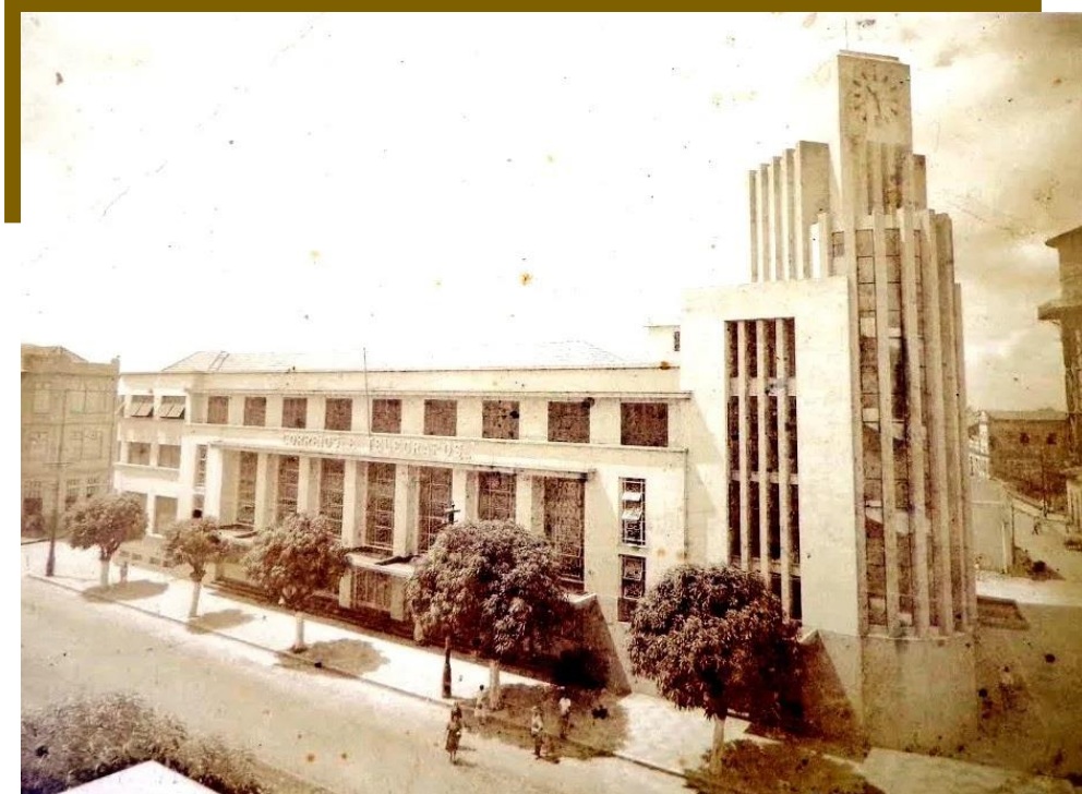
Figura 7- Correios – Belém PA – APT e Diretoria Regional-esquina posterior