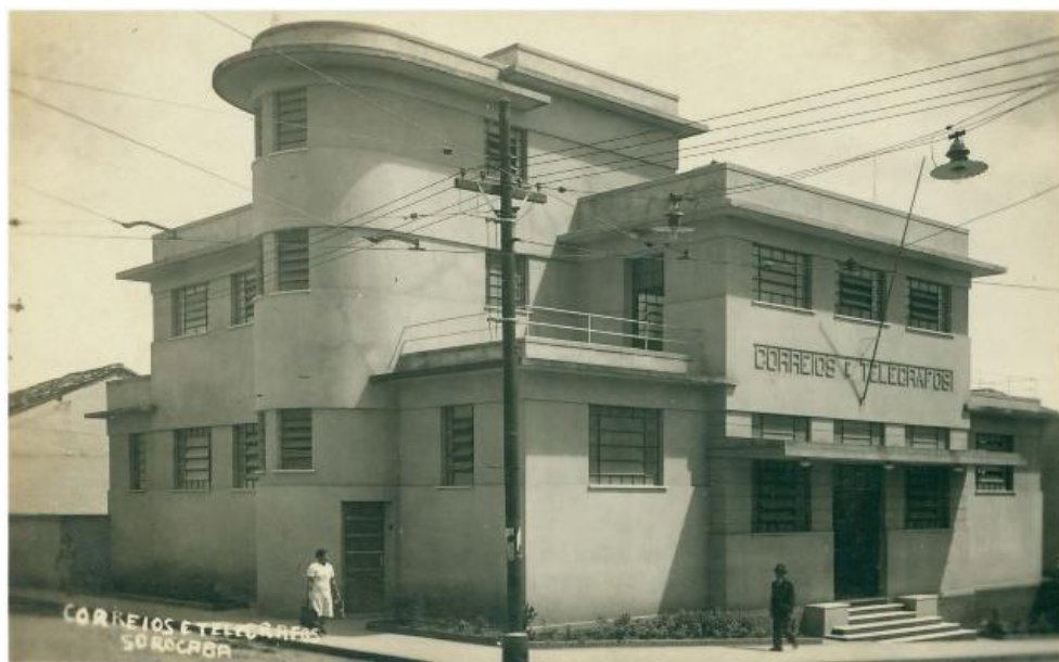
Figura 4 – APT Sorocaba