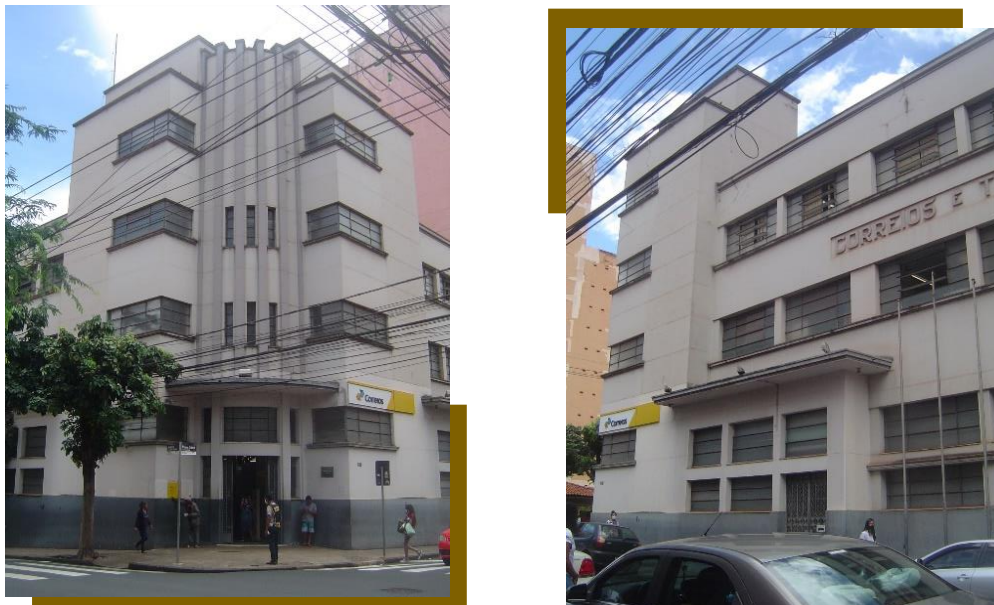
Figura 5- Correios – Ribeirão Preto SP – APT e Diretoria Regional