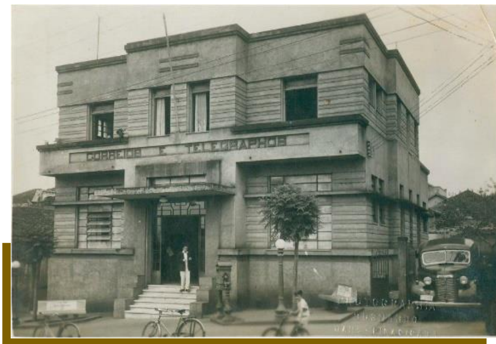
Figura 3 – APT Jaú, exemplo do Tipo Especial II, demolida