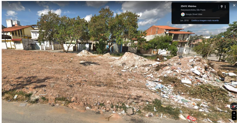
Figura 4 – Ponto viciado de descarte irregular – Rua Vitórin – Bairro: Arizona

públicos para arrecadação de recicláveis. A Figura 4 ilustra a situação da Rua Vitórin, nº 254, situada no bairro Arizona em meados de 2018, referente ao descarte inapropriado de detritos em um local de armazenamento não sancionado.