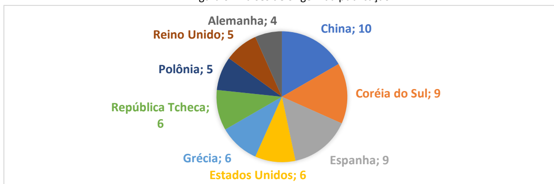
Figura 6 – Países de origem da publicação

Quanto aos países de origem das publicações, os de maior destaque são China com 10 publicações, seguida da Coreia do Sul e a Espanha, ambos com 9 publicações (Figura 6).