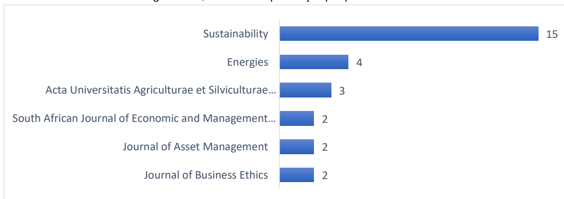
Figura 5 – Quantidade de publicação por periódico

Considerando o total de artigos da amostra, 45 periódicos tiveram apenas uma publicação sobre o tema ESG. Na Figura 5 é possível verificar o total de publicações dos 6 periódicos que mais publicaram sobre o assunto no período de 2011 até abril de 2023.