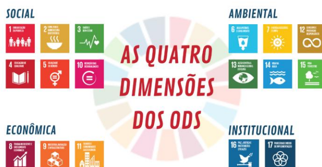
Figura 1 - As quatro dimensões dos ODS