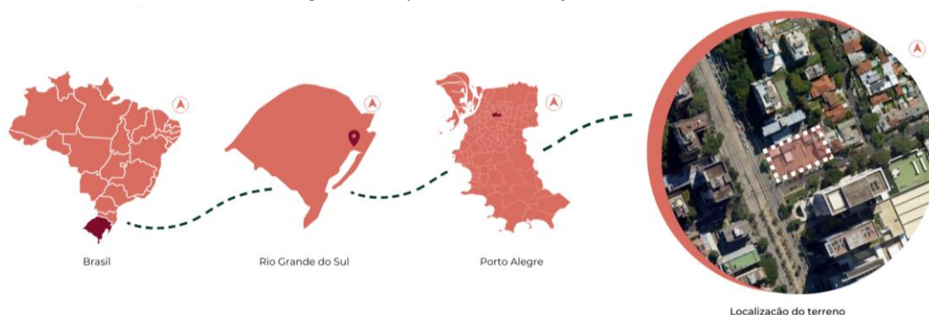
Figura 1 – Esquema de localização do terreno

Sendo assim, na disciplina de Projeto VII do curso de Arquitetura e Urbanismo da Universidade Federal de Santa Maria, campus Cachoeira do Sul, elabora-se o projeto de um edifício corporativo na cidade de Porto Alegre, RS. Ao combinar a complexidade de uma zona subtropical úmida com o impacto característico de um edifício em altura, as questões ambientais tornam-se demandas no desenvolvimento deste exercício projetual.