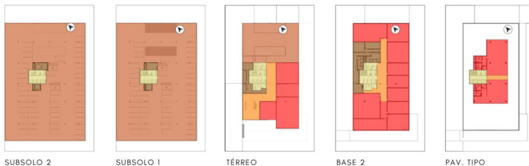
Figura 3 – Esquema de zoneamento.

A etapa do partido geral é compreendida como a evolução da fase anterior, amadurecendo algumas definições da viabilidade para que a proposta ocorra de forma mais precisa. O organograma e o zoneamento funcional (Figura 4) são transformados em plantas resolvidas, e os cálculos necessários, como vagas de estacionamento, reservatórios, população para elevador e sanitários, todos pertencentes ao projeto contra incêndio, são elaborados.