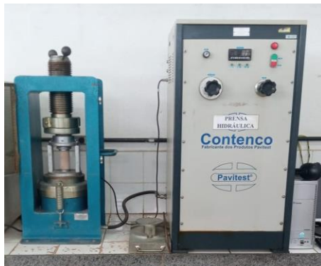
Figura 3 – Prensa usada no ensaio de compressão

de prova com idade de 28 dias, após a cura em câmara úmida. Para execução do ensaio, foi utilizado uma prensa com capacidade de 100 toneladas, da marca CONTENTCO, modelo I 3025 B, como demonstrado na Figura 3.