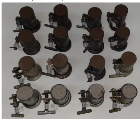
Figura 2 - Corpos-de-prova moldados em cilindro

Os corpos de prova moldados (Figura 2) foram desmoldados dos cilindros 24 horas após a moldagem e foram colocados em câmara úmida por 28 dias, conforme indicado na NBR 13276 (2005).