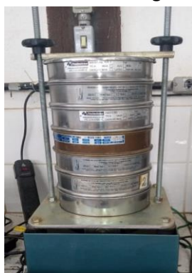
Figura 1 – Peneiramento em agitador mecânico.

A determinação da composição granulométrica da areia e do rejeito de minério de ferro foi feita baseada na norma NBR 7217/1987. Foi utilizado um conjunto de peneiras da série normal, sucessivas com as aberturas (mm) 4,75; 2,36; 1,18; 0,6; 0,300 e 0,150. O peneiramento foi realizado por meio de agitador mecânico conforme Figura 1.