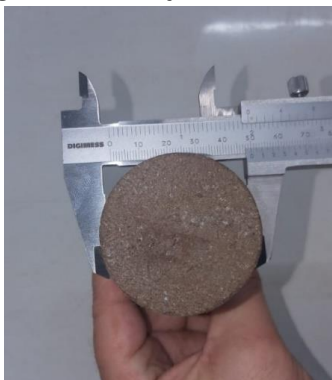
Figura 4 – Medição do diâmetro

Os ensaios de resistência à compressão foram realizados baseados nas normas ABNT NBR 13279/1995 e NBR 7215/1996. Foram medidos os diâmetros dos corpos-de-prova (Figura 4) e em seguida, foram colocados na prensa (Figura 5) para o rompimento.