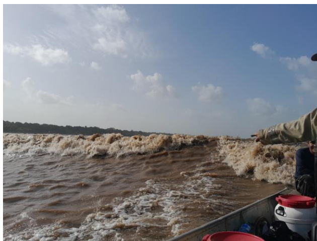
Figura 1- Pororoca no Rio Cassiporé, em abril de 2023