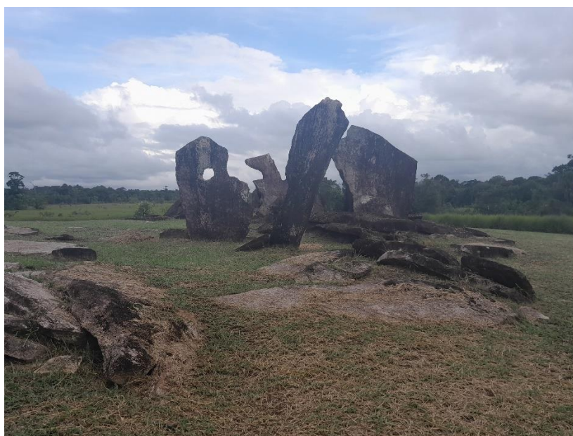
Figura 4-Sítio Megalítico Rêgo Grande

Além das grandes rochas (figura 4) que formam um círculo, no alto de uma colina, foram encontrados alguns fragmentos de cerâmicas, que podem ser urnas funerárias visto que as “estruturas batizadas de poços funerários, construídas junto aos monolitos e escavadas pela primeira vez pelo casal gaúcho (Mariana Cabral e João Saldanha), o que se encontrou foram cerâmicas da fase Aristé (ou Cunani)” (UFCG, 2006).