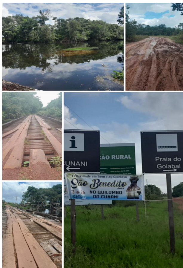
Figura 3- Mosaico de imagens do acesso sul do PNCO

Ao acessar a Avenida dezessete de agosto, em Calçoene, o turista/visitante irá se deparar com uma bifurcação (conforme imagem a seguir), sinalizada, que indica a estrada para a Vila de Cunani e para a Praia do Goiabal 2 , este seguirá o acesso ao Cunani e a região sul do PARNA. Importante frisar que o turista passará por aproximadamente 10 pontes de madeira (algumas em situação precária de conservação, conforme a Figura 3) até chegar à Vila de Cunani, que possui área sobreposta pelo Parque.