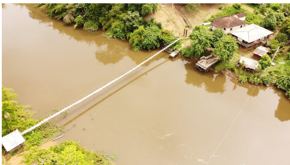
Figura 5- Ponte sobre o rio Cunani

Ao sair da sede de Calçoene, o turista levará em torno de 1h30min de carro até a Vila de Cunani. Historicamente, a vila de Cunani foi de grande importância no período de disputa entre Brasil e França, nos anos de 1836 e 1900, o que ficou conhecido como o Contestado Franco-Amapaense (ou Franco-Brasileiro). Em pouco tempo de existência, Granger (2012, p, 24) afirma que a “República do Cunani em apenas um ano de existência, teve tempo de emitir selos e moeda”. Atualmente, o turista que visitar a Vila de Cunani, poderá visitar o Centro Cultural, inaugurado no 2º semestre de 2023. Além disso, ao adentrar na Igreja de São Benedito, o visitante pode observar os sinos centenários da vila.