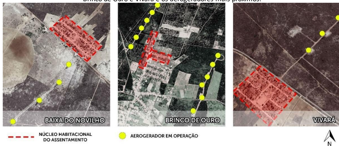
Figura 2 — Respectivamente, os núcleos habitacionais dos assentamentos Baixa do Novilho, Brinco de Ouro e Vivará e os aerogeradores mais próximos.