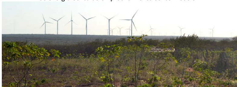
Figura 3 – Vista dos lotes de habitação do assentamento Maria da Paz com presença das torres de energia eólica do empreendimento eólico Modelo II.

A paisagem do assentamento Maria da Paz atualmente é marcada pela presença de aerogeradores, que se expandiram pelo município na última década e se avizinham de seu território, instalados em grandes propriedades e em algumas comunidades rurais (figura 3). São estes os empreendimentos eólicos próximos ao assentamento: Ventos de Santo Uriel, Modelo I e II, Santa Maria e Santa Helena. Apesar de o assentamento não ter nenhum aerogerador em seu território, pode-se avistá-los no horizonte, assim como, à noite, várias luzes vermelhas intermitentes demonstram as suas presenças.