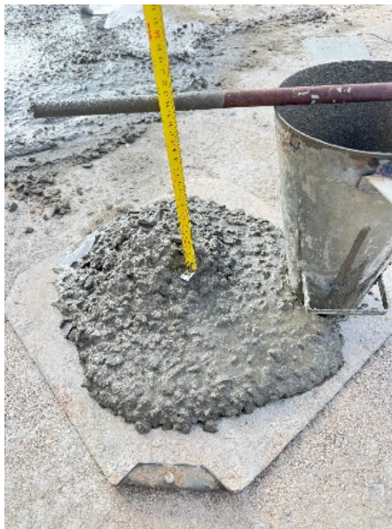
Figura 1 - Ensaio de abatimento (Sump test)

ensaio. O valor obtido em cada ensaio foi anotado servindo como parâmetro do fator água/cimento de cada traço. Conforme registrado na figura 1.