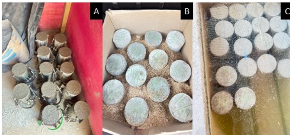
Figura 2 – A) armazenamento; B) transporte; C) cura dos corpos de prova.

A moldagem dos corpos de prova foi realizada em campo, imediatamente após a coleta, respeitando os procedimentos descritos na ABNT NBR 5738:2015. Cada corpo de prova foi preenchido em duas camadas e adensado manualmente com haste metálica com doze golpes em cada camada conforme estabelecido pela norma. Após a moldagem, os corpos de prova permaneceram em repouso por 24 horas em local protegido de intempéries. Posteriormente, foram coletados e devidamente transportados em caixas de areia até o laboratório, onde foram submetidos à cura úmida por 28 dias, em tanques de imersão, preservando a temperatura e umidade conforme exigido pela mesma norma. Os procedimentos acima descritos foram registrados conforme figura 2.