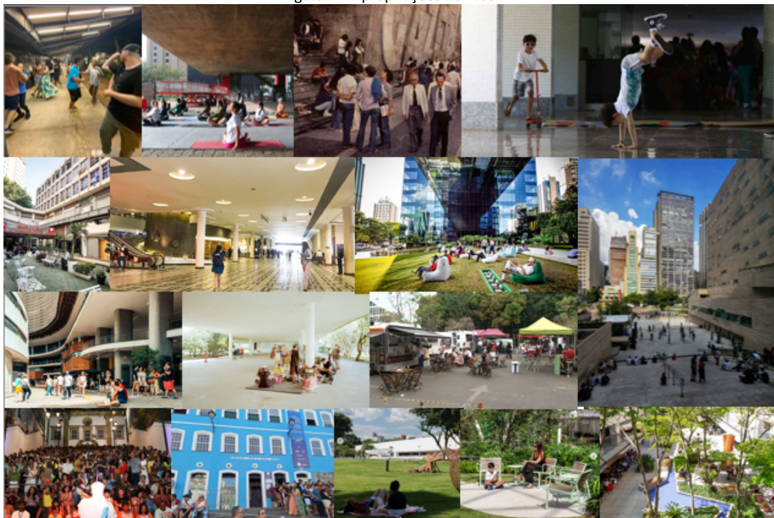
Figura 1 – Apropriações no Brasil

Fonte: Da esquerda para a direita e de cima para baixo – CCSP (autor); MASP (Terra); Escadaria da Gazeta (Facebook Fundação Casper Líbero); Pilotis (Correio Brasiliense); Centro comercial do Bom Retiro (Veja SP); Conjunto Nacional (Deusa Rodrigues); Pátio Victor Malzoni (Veja São Paulo); Praça das Artes (Brasil Arquitetura); Copan (Caos Planejado); Marquise do Ibirapuera (Nexo Políticas Públicas); Esplanada dos Ministérios (Portal G1); Escadaria do Passo (Alo Alo Bahia); Escadaria da Fundação Casa Jorge Amado (Correio Brasiliense); Museu do Olho (Instagram MON); Rua da Saúde (Instragrammmcite.br); Brascan Centery Plaza (Brascan Centery Plaza).