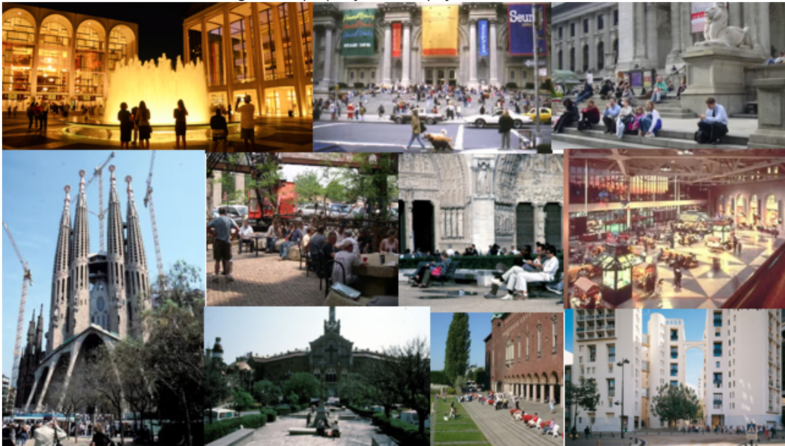
Figura 2 - Apropriações em espaços internacionais

Fonte: Da direita para esquerda e de cima para baixo – Lincoln Center (New York Theatre Guide); The MET (PPS); Biblioteca Pública de Nova York (PPS); Basílica da Sagrada Família (PPS); The City Museum (PPS); Catedral de Notre-Dame(PPS); South Station (PPS); Hospital de la Santa Creu I de Sant Pau (PPS); Stockholm City Hall (PPS); Les Hautes Formes (Achitetuul).