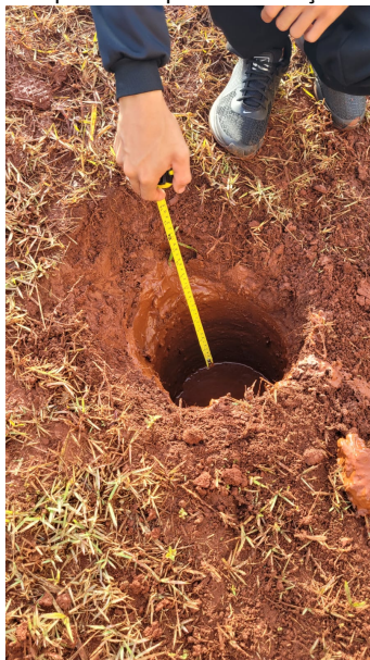
Figura 2: Cavidade perfurada para a realização do plantio direto

Observando o espaço físico da escola, em uma grande conjuntura envolvendo professores, alunos, grupo pedagógico, direção, e técnicos da Secretária do Meio-Ambiente de Londrina, apontamos alguns possíveis pontos estratégicos para efetuar o plantio arbóreo. Decidiu-se que as árvores seriam plantadas em um total de vinte e cinco, distribuídas entre face norte da escola, para que suas sombras pudessem ser projetadas sobre os blocos 1 do colégio, onde se localiza a direção, salas de informática e recursos, bem como o bloco 2, este comportando várias salas de aulas. As árvores nesta face foram plantadas com um intervalo de espaço de sete metros de distância uma das outras, proporcionando em um futuro próximo que as sombras projetadas façam um grande corredor de conforto térmico.