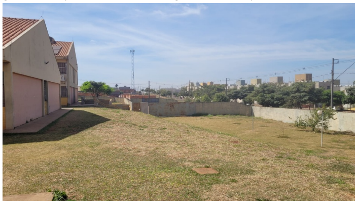
Figura1: Vista para a face sul do colégio, bem como para o estacionamento.

A figura abaixo, demonstra muito bem o que estamos discutindo no presente artigo, bem como o que analisamos junto aos alunos em sala e em aula de campo, um grande espaço vazio, banhado pela insolação, impossibilitando sua utilização para possíveis atividades pedagógicas e afins.