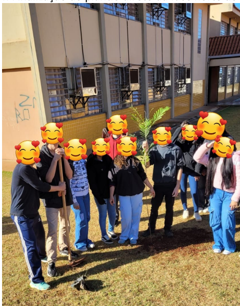
Figura 4: Finalização do plantio direto da face norte do colégio.

Abaixo, segue a imagem de finalização do projeto com os alunos, notamos uma muda de árvore que tínhamos acabado de plantá-la, bem como a ferramenta no caso uma inchada, que utilizamos para a escavação da cavidade berço da espécie arbórea.