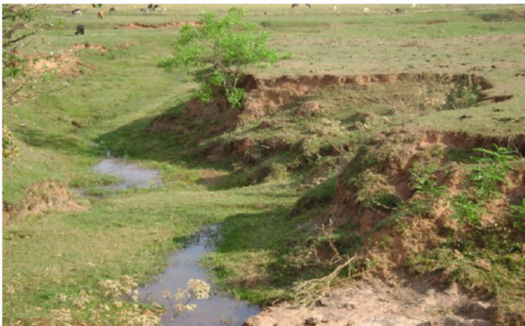
Figura 3 – Processo de assoreamento do córrego Tainús .

Como parte da área urbana do município de Adamantina está inserida na microbacia, faz com que a mesma receba água das chuvas com resíduos sólidos, pelo arraste das enxurradas nas vias públicas e do descarte clandestino de lixo nas estradas rurais, o que caracteriza uma fonte de poluição difusa. As voçorocas que se desenvolvem na área urbana estão ligadas diretamente ao lançamento de águas de chuva ou através do arruamento. A necessidade de lançamento das águas pluviais e servidas em drenagens próximas às zonas urbanas, que não comportam um grande incremento de vazão, aumentando significativamente o pico de enchente, a microbacia vai sofrendo um rápido processo de entalhamento e alargamento do leito.