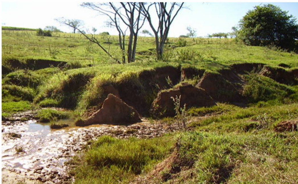
Figura 4 - Pontos das nascentes do córrego Taipús, sem proteção da mata ciliar.

As nascentes do córrego Taipús e também de seus afluentes, que margeiam a mancha urbana, estão, na grande maioria, sem proteção vegetal e apresentam alto grau de poluição, por despejo de resíduos sólidos. As propriedades rurais, que também possuem nascentes, quase na totalidade, não possuem cobertura vegetal para preservá-las (Figura 4).