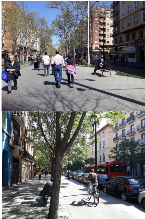
Figura 2: Paseo de la Gran Vía e Rua Coso, Zaragoza, ES.

Nos trabalhos de Jan Gehl encontramos referências conceituais e projetuais sobre a conformação das cidades, o ponto de referência destacado é a escala humana e a partir dela são estabelecidos os critérios de análise para compreensão das relações entre nós e a cidade. Assim os parâmetros relevantes para que esta relação entre o pedestre e a cidade aconteça está na relação direta entre escala e os sentidos, como por exemplo, a visão e a comunicação que acontece nas fachadas ao longo das ruas. Essas referências podem ser mensuradas e analisadas para compreensão e consideração no ato de projeção, o papel da arquitetura, sem questionar seu estilo, ou seu momento temporal, deve ser pensado enquanto produção de espaço com vida, incluindo a dinâmica capaz de criar a vitalidade desejada nos arquitetura urbana. Vale lembrar que a apreensão do espaço se realiza quando nele estamos e dessa forma, principalmente a interface dos pavimentos térreos ao longo da via têm em si aspectos físicos e de percepção que podem proporcionar o convite ao pedestre a transitar.