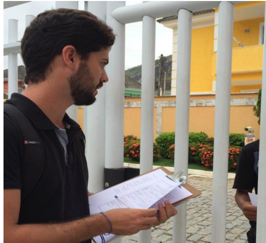
Figura 6: Pesquisa com moradores do entorno da ETR Jacarepaguá