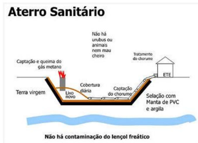
Figura 3: Estrutura de um Aterro Sanitário