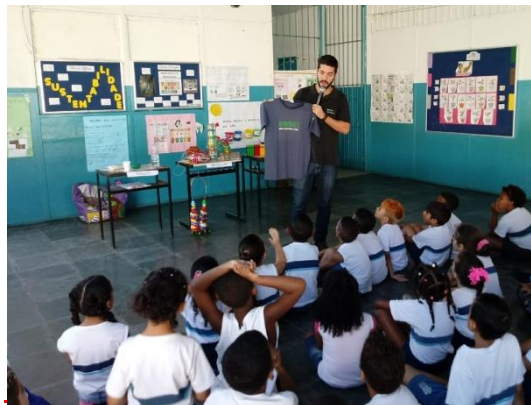
Figura 8: Atividade ambiental com crianças - Escola Municipal Alípio Miranda Ribeiro, Coelho Neto, RJ

Em paralelo as ações mencionadas também ocorreram atividades de educação ambiental nas escolas com o objetivo de oferecer informação às crianças através de oficinas e palestras. Estas atividades possuem o intuito de sensibilizar não só as crianças, mas também os professores e responsáveis dos alunos, resultando em um envolvimento desse público alvo nos aspectos ambientais ligados aos resíduos sólidos.