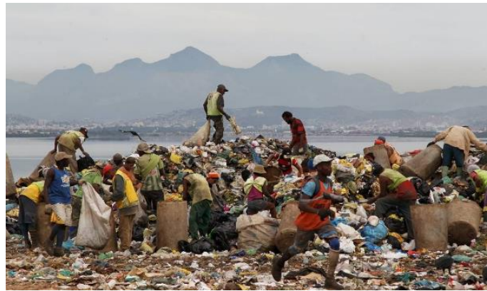
Figura 1: Catadores trabalhando no lixão de Gramacho, RJ