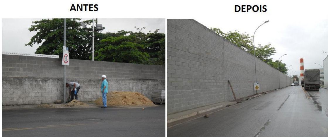
Figura 10: Antes e depois do aumento do muro - ETR Marechal Hermes, Coelho Neto, RJ