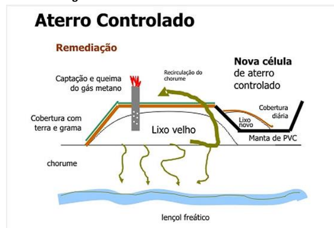
Figura 2: Estrutura de um Aterro Controlado

MOUSINHO (2003) define aterro controlado como: “Antigos lixões que passaram por algum tratamento técnico, mas que não têm a segurança e o controle de um aterro sanitário”.