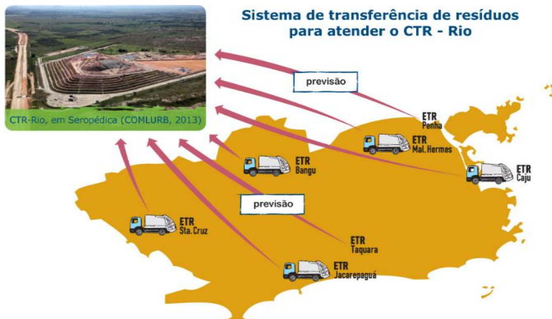
Figura 5: Logística de transferência de resíduos.