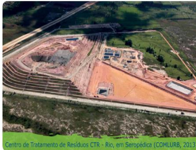
Figura 4: Centro de Tratamento de Resíduos em Seropédica.