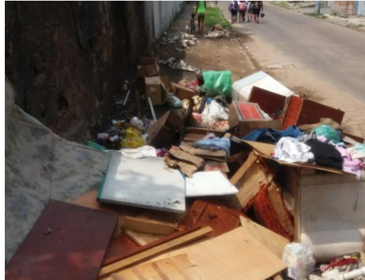
Figura 7: Descarte irregular de lixo - Rua Agenor Porto s/n