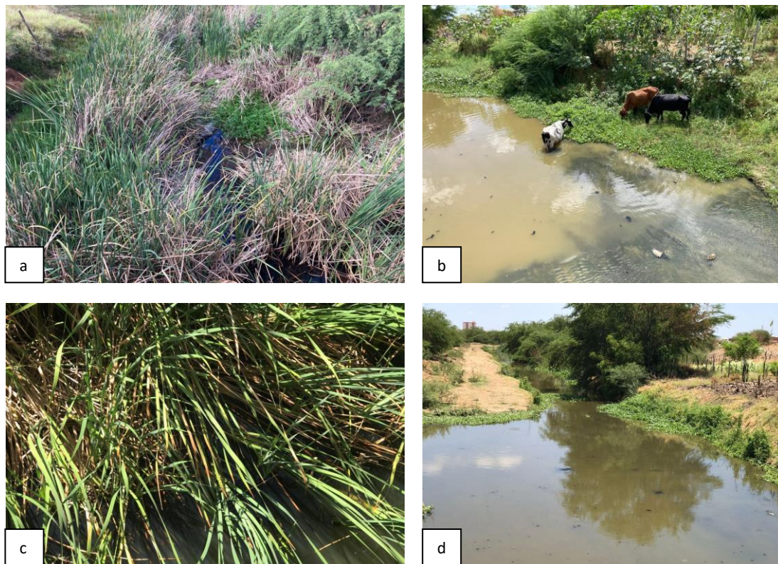
(a) Ponto de coleta P1 em abril de 2022; (b) Ponto de coleta P5 em abril de 2022; (c) P1 em outubro de 2022; (d) P5 em outubro 2022.