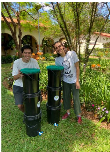
Figura 2 – Integrantes da empresa Júnior Biocenos ao lado da composteira produzida pela empresa