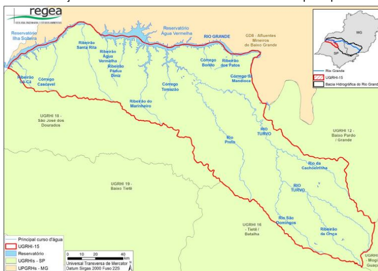
Figura 1 – Localização da UGRHI 15 no Estado de São Paulo e seus principais cursos d'água.

A área de estudo compreende a Bacia Hidrográfica dos Rios Turvo e Grande que pertence a Unidade de Gerenciamento de Recursos Hídricos dos Rios Turvo/Grande (UGRHI 15) localizada na região Noroeste do Estado de São Paulo com divisa no Estado de Minas Gerais abrangendo 66 municípios (Figura 1).