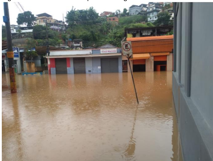
Figura 2: Enchente no município de Carangola