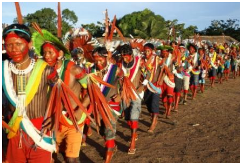
Figura 5 - Festa dos Homens, Memybiôk , aldeia Kubenkokre.