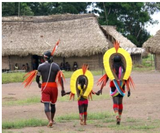
Figura 4- Família adornada por artefatos plumários

A plumária Kayapó é usada essencialmente durante os grandes rituais de nomeação e iniciação masculina, no casamento, na esteira e paramentação do morto durante os ritos de passagem. De modo geral, os enfeites de pena se relacionam com a vida cerimonial em oposição ao cotidiano, quando prevalece a pintura corporal como único adorno do corpo.