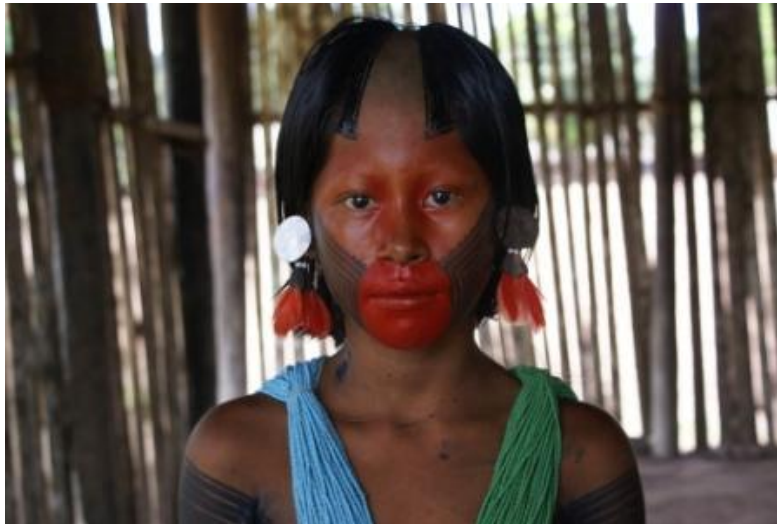
Figura 3 - Corte de cabelo Kayapó (Luis Carlos S. Sampaio, 2010).

As guerras entre as tribos do complexo cultural do Xingu e as outras da periferia da área, mostram que as mulheres são cobiçadas, alvo de raptos e de agressões sexuais. As mulheres são consideradas um ponto vulnerável da sociedade e face às forças espirituais que as rodeiam. Observa-se a ligação entre a mulher, cabelo, sexo e outras atitudes agressivas. Informantes dessa tribo disseram que seus antepassados não cortavam os cabelos, penteando-os diariamente. Untam-nos com óleo de babaçu (uma palmeira) para torná-los macios.