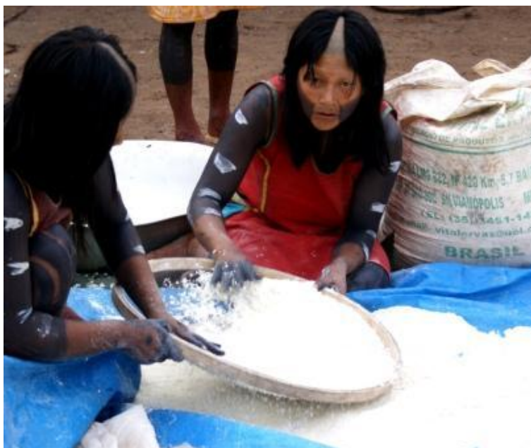
Figura 6 - Elabora massa de farinha para Juwocupú o grande bolo de farinha de mandioca embrulhado em folhas de bananeira, com pedaços de carne de caça ou peixe (Luis Carlos S. Sampaio, 2010).

que os alimentos não se ressequem, não tomem gosto de fumaça ou fiquem sujos de terra. Cada mulher coloca assim a comida preparada por ela o que é quase sempre o sustento do dia para a família.