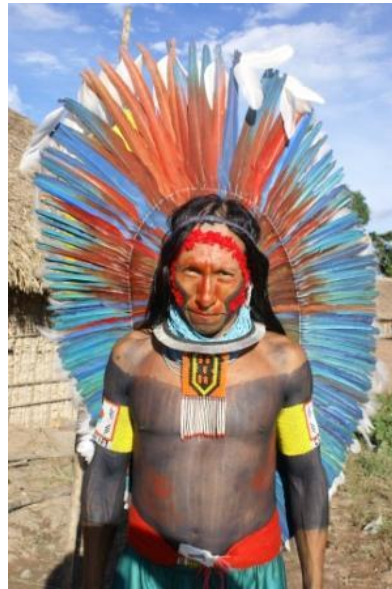
Figura 2- Pintura Corporal realizada na festa dos Homens, aldeia Kubenkokre (Luis Carlos S. Sampaio, 2010).

No corpo, o sangue corre seguindo um traçado natural das veias e artérias. Mas sobre o corpo o homem “realiza a arte” com desenhos em vermelho, testemunha de uma vida social intensa, como só os índios sabem executar. Essa pintura corporal é completada pelo preto, cor da criatividade, que é o outro aspecto da natureza humana.