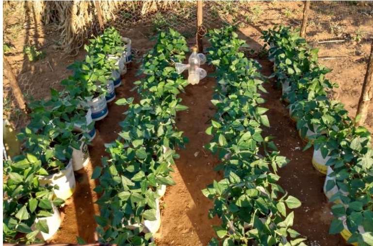
Figura 1 - Vista parcial da área experimental, Sítio Baixio, Quixaba-PE em julho de 2021.