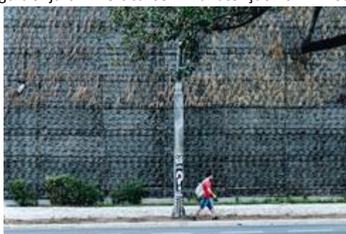
Figura 5- jardim vertical sem manutenção no Minhocão.

Apesar do crescente número de pesquisas nas abordagens supracitadas, esses sistemas ainda encontram dificuldades de sobrevivência a longo prazo. Köhler (2008) discursa que Jardins verticais podem ter uma vida útil de 10 anos, porém, exemplos como os jardins verticais no Elevado Presidente João Goulart em São Paulo – popularmente conhecido como Minhocão (Figura 5) –, representam a dificuldade de manter o sistema, uma vez que precisaram ser substituídos a cada 3 anos devido à carência de manutenção.