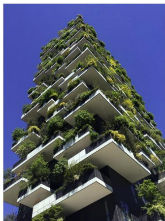
Figura 2 - Bosco Verticale.