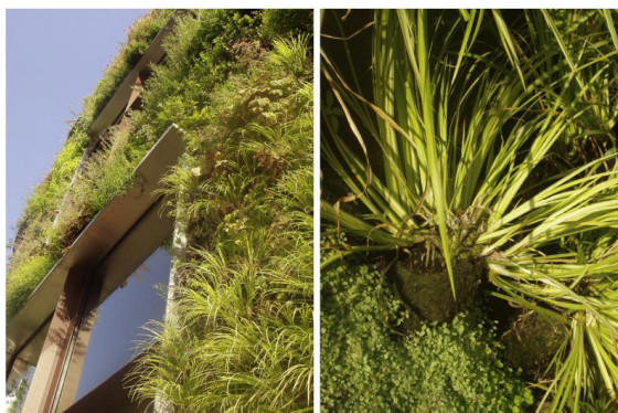
Figura 1 - Musée du quai Branly.