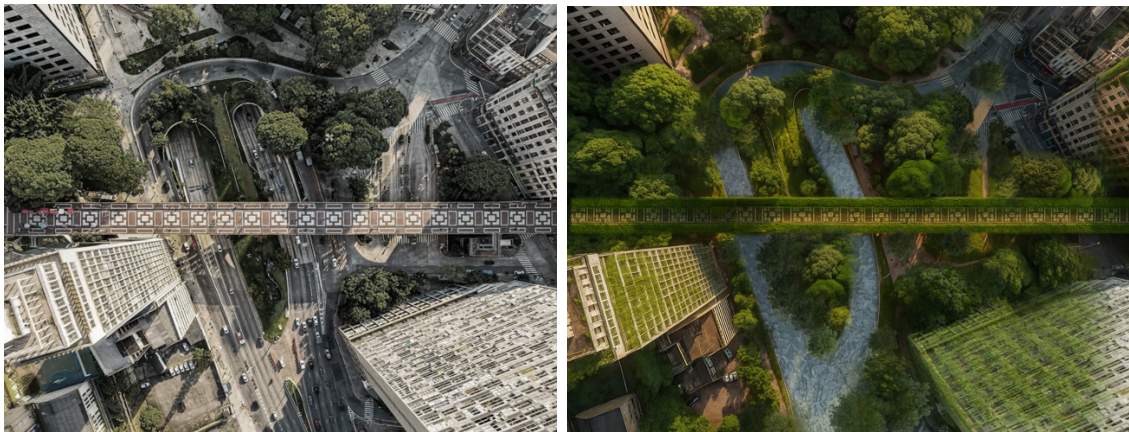
Figura 1 –Verdejamento do Viaduto Santa Efigênia.