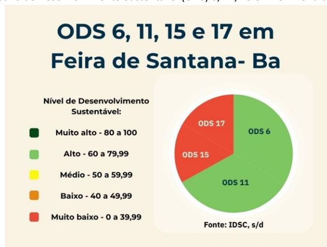
Figura 03- Objetivo de Desenvolvimento Sustentável (ODS) 6, 11, 15 e 17 em Feira de Santana- Bahia

Para avaliar se as cidades estão alcançando ou já alcançaram os ODS, o Índice de Desenvolvimento Sustentável das Cidades (IDSC), avalia determinados tipos de indicadores para cada ODS. No que tange à situação de Feira de Santana, temos que a cidade apresenta um baixo nível de Desenvolvimento Sustentável, com uma pontuação geral de 47,32 de um total de 100. No que tange ao nível de desenvolvimento dos ODS 6, 11, 15 e 17 ODS na cidade de Feira de Santana, temos os seguintes dados ilustrados na Figura 3.