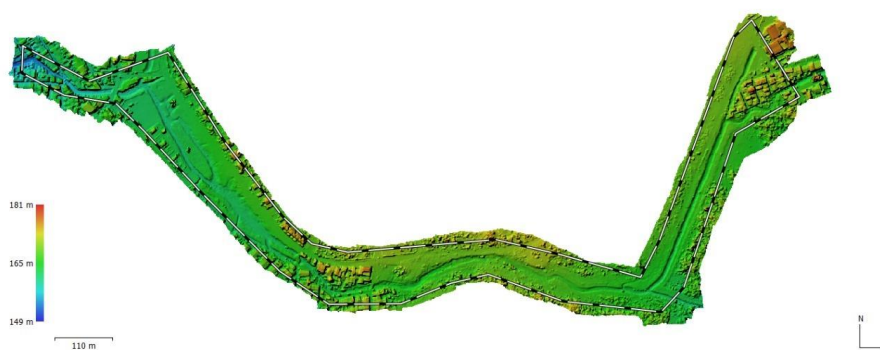
Figura 02. Ortofoto da área da bacia Olhos D'Água para implantação do Parque Linear

Os produtos advindos do voo com drone, como a ortofoto (Figura 2) e as curvas de nível, foram utilizados para a geração do modelo do Parque Linear nos softwares Sketchup e Twinmotion.