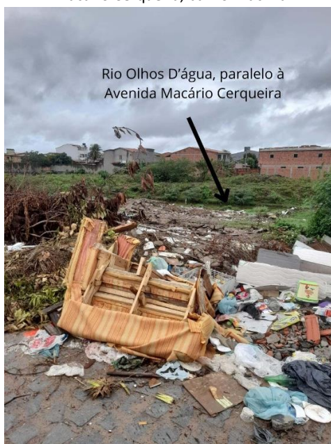
Figura 05- Resíduos domésticos, comerciais e restos de construção nas margens do Rio Olhos D'Água, na Avenida Macário Cerqueira, bairro Muchila