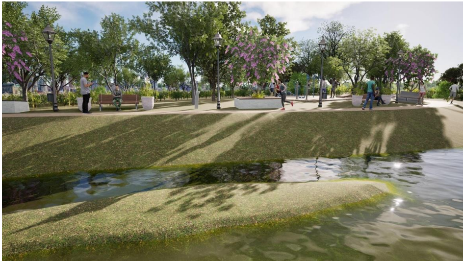
Figura 11. Pista de caminhada paralela aos terraços do Rio Olhos D'Água