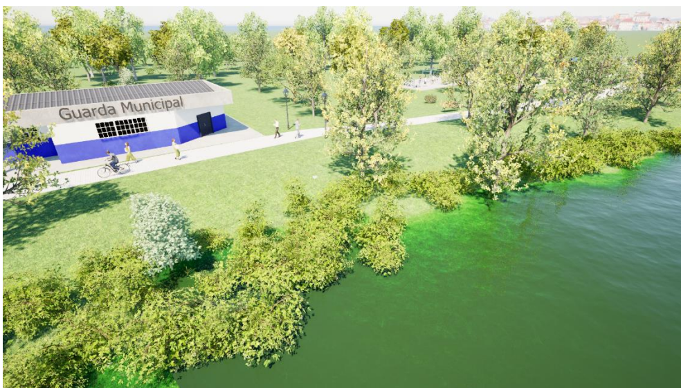
Figura 09- Guarda municipal paralela à pista de caminhada e ao Rio Olhos D'Água na área próxima à nascente do Rio