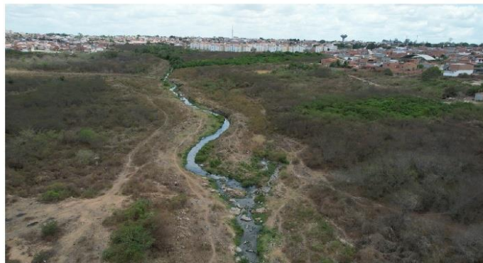
Proposta com o Parque Linear