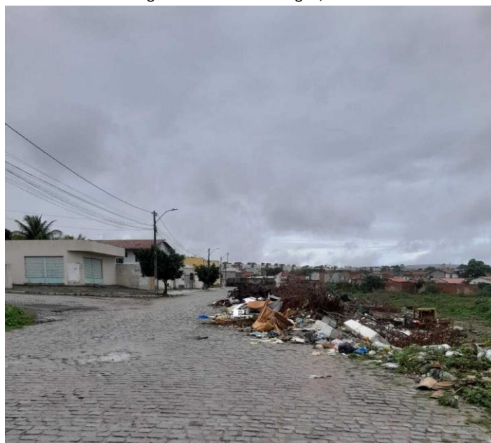
Figura 04- Avenida Macário Cerqueira, à esquerda, e resíduos domésticos, comerciais e restos de construção nas margens do Rio Olhos D'água, à direita