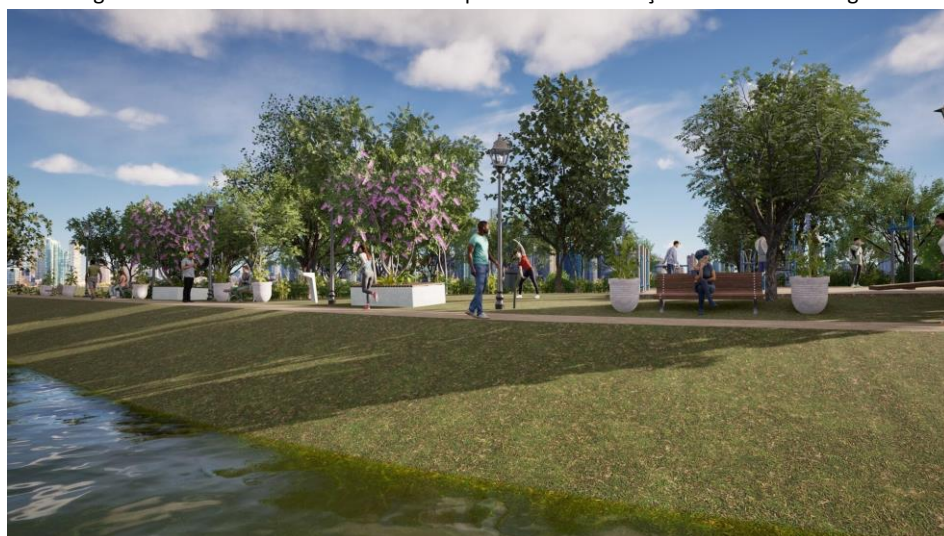
Figura 12. Pista de caminhada e bancos paralelos aos terraços do Rio Olhos D'Água