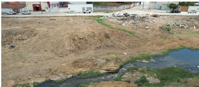
Proposta com o Parque Linear