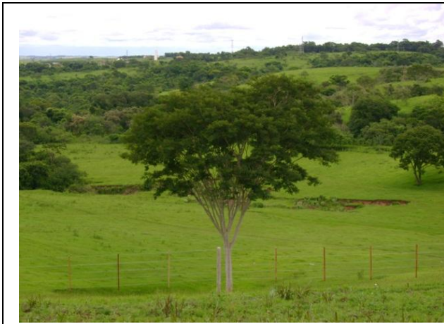
Foto 5 – Voçoroca ao fundo próxima aos cursos d'água