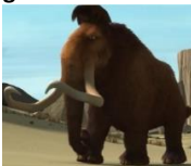
Figura 10: Mammoth