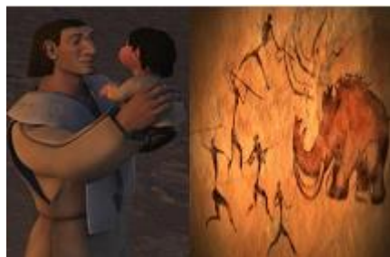
Figura 11: O Homem da época