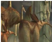
Figura 8: Myrmecophaga