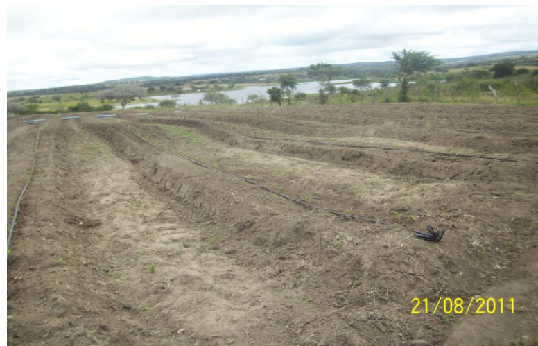
FIGURA 2: Preparo do solo para irrigação e plantio de tomate, visualizando-se a Barragem Cajarana ao fundo.

Os nitratos são sais derivados de ácidos nítricos, que é uma fórmula oxidante com muitas aplicações industriais e uma vez ingerido, causa sérias implicações na formação do feto em gestantes.