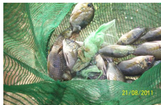
FIGURA 6: Peixes CARÁS em rede de pescador. Fonte: Pesquisa de campo, ago. 2011. Fonte: MORAIS, L. V. 2011.

Embora não se tenha feito um estudo mais aprofundado em relação a piscicultura local, pode-se perceber que há uma dificuldade incontestável em se pescar peixes ou outro animal aquático com dimensões adequadas para o consumo, sem falar do