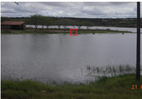
FIGURA 5: Pescadora na barragem Cajarana.

Como já observado no início do trabalho, esse reservatório é utilizado com frequência pelos moradores locais e da redondeza como área de lazer. A pesca, então, se constitui numa atividade comum e sem custos adicionais para a distração (Figura 5)., sendo o peixe mais pescado o CARÁ (Figura 6).