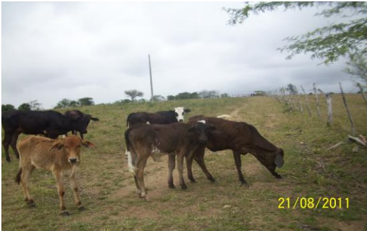
FIGURA 3: Criação de bovinos nas margens do espelho d'água da Cajarana.