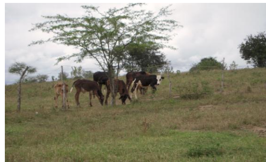
FIGURA 4: Bovinos à sombra das algarobas, próximo do espelho d'água da Cajarana