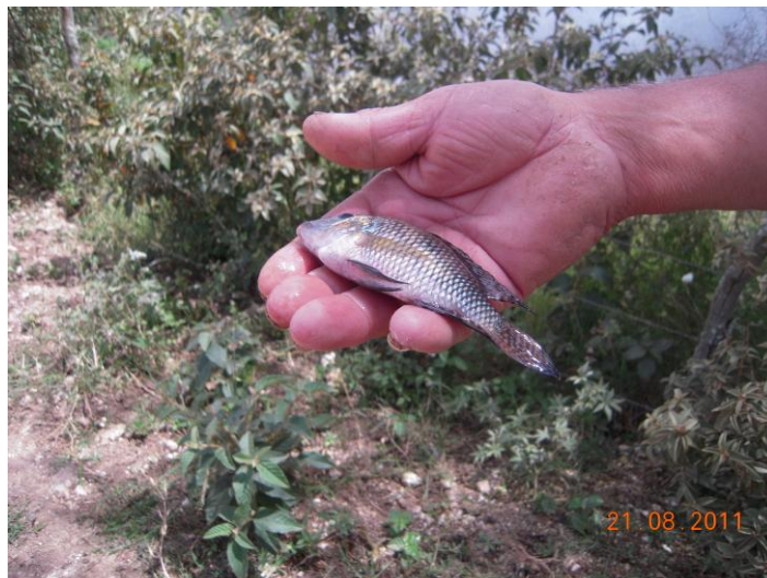
FIGURA 7: Visualização do tamanho do peixe pescado na Barragem Cajarana, apenas 10cm. Fonte: Pesquisa de campo, ago. 2011. Foto de Maria Amador. 2011.

problema da contaminação. No momento de uma das visitas ao campo para coleta de dados, retratou-se o fato do tamanho do peixe Geophagus brasiliensis , vulgarmente conhecido como CARÁ (Figura 4), cujo pescador e agricultor confessou ser sabedor que não estava no ponto para consumo, afirmou que eles chegam ao dobro do tamanho, ou seja, cerca de 20cm. O da foto estava com 10 cm (Figura 7), mas servia para um tira-gosto. É uma espécie nativa do Brasil tanto em tanques como em rios.