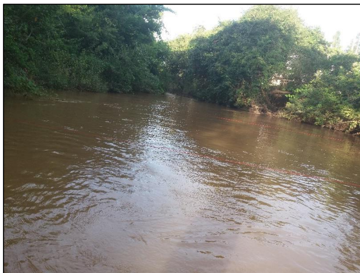
Figura 2: Seção superior no rio Canastra

comprimentos de 15,72 m (seção a montante ou superior) e 17,58 m (seção jusante ou inferior), quatro estacas, martelo, trena, régua, cronômetro e uma garrafa pet. A figura 2 mostra a seção a montante do experimento. Escolheu-se um trecho do rio linear, evitando trechos com muitas curvas, o que poderia influenciar no resultado. O monitoramento da vazão do Rio Canastra foi realizado do mês de dezembro de 2017 ao mês de novembro de 2018.