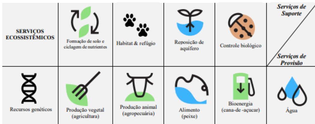
Figura 1 – Serviços ecossistêmicos de Suporte e Provisão encontrados em Teodoro Sampaio, SP.