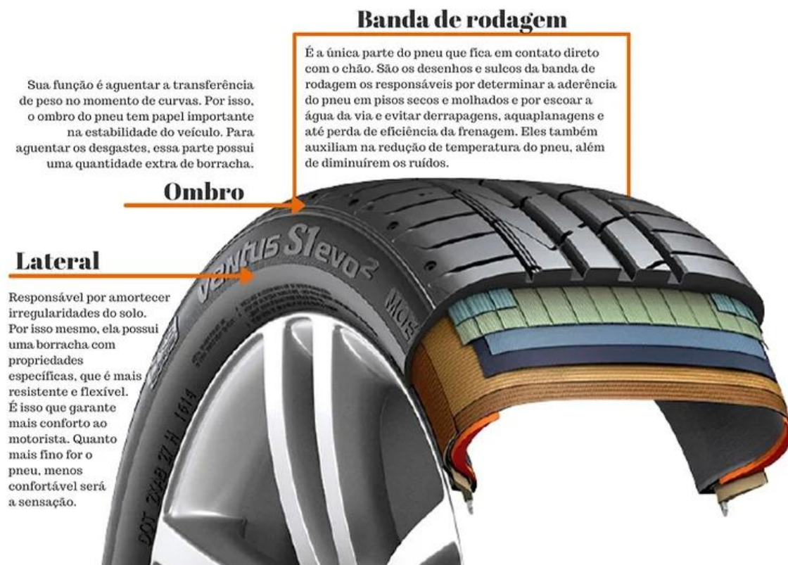
Figura 2 – Descrição das partes do pneu