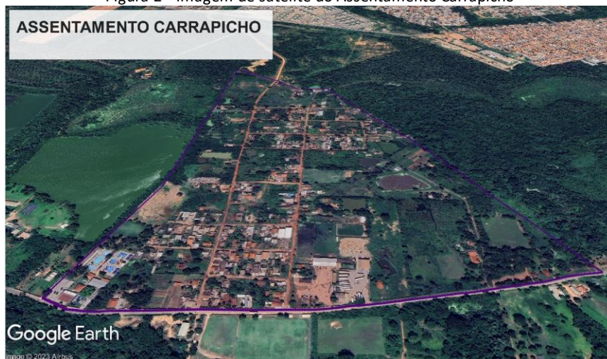
Figura 2 - Imagem de satélite do Assentamento Carrapicho