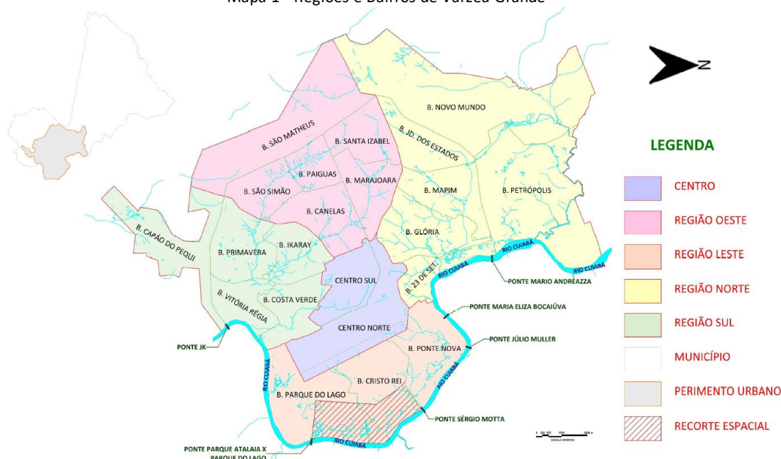
Mapa 1 - Regiões e Bairros de Várzea Grande

Fonte: Mapa da Lei do Abairramento – LC nº 3356 de 2009, adaptado pelo Autor (2023).