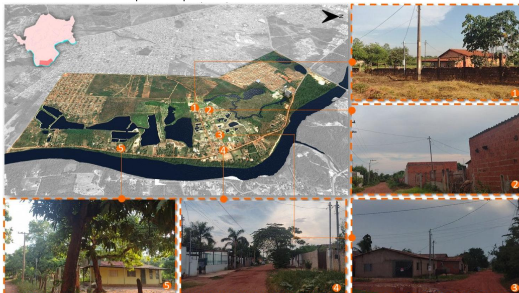
Mapa 6 - Mapeamento – Padrão Construtivo das Moradias

As moradias existentes são decorrentes de autoconstrução, apresentando baixo padrão construtivo, com estrutura precária e ausência de acabamentos (Mapa 7).