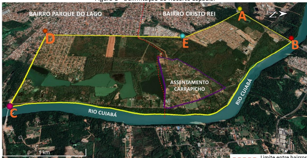
Figura 1 - Delimitação do Recorte Espacial