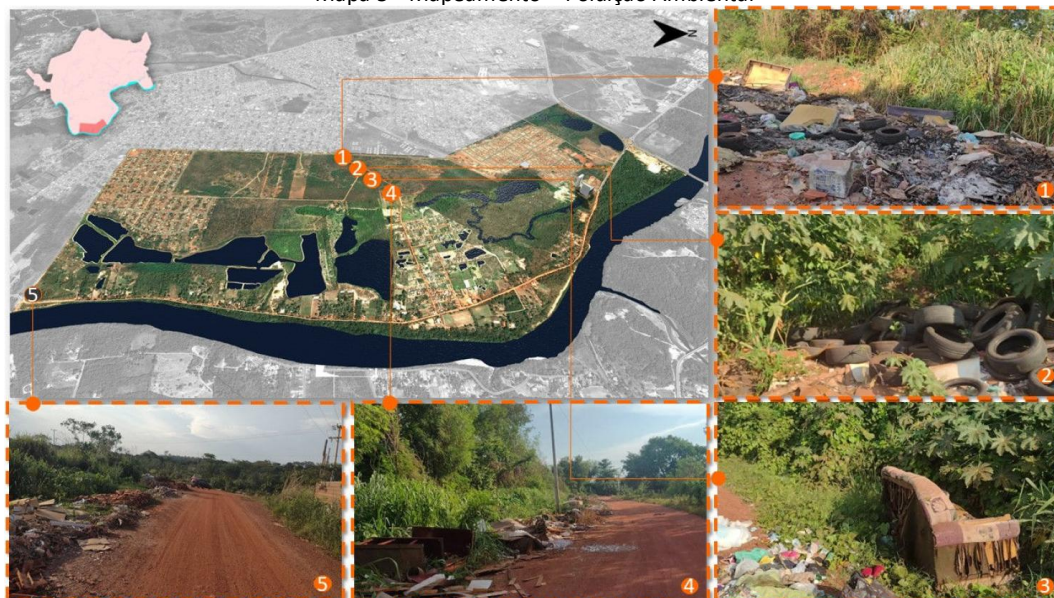
Mapa 5 - Mapeamento – Poluição Ambiental

A área em estudo convive com o abandono e descaso do poder público e, apesar de todo o seu potencial ambiental, a área recebe diariamente despejos ilegais de lixo, intensificando a poluição e degradação ambiental (Mapa 6).