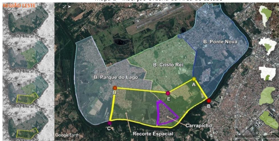
Mapa 2 - Inserção Urbana da Área de Estudo