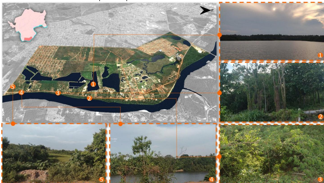
Mapa 4 - Mapeamento - Potencialidades Ambientais