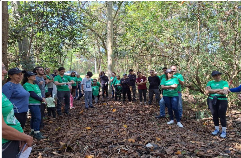
Figura 1 – Dia de mutirão de limpeza e plantio de árvores na APP Jardim Miriam, em Campinas, SP.