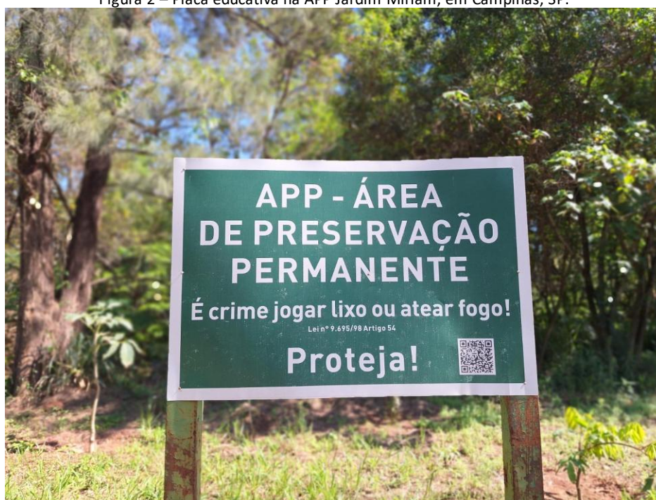
Figura 2 – Placa educativa na APP Jardim Miriam, em Campinas, SP.

No dia de mutirão de limpeza e plantio de árvores na APP Jardim Miriam, ilustrado na Figura 1, membros do coletivo e voluntários contaram com o apoio da iniciativa privada para recolher e transportar todos os resíduos encontrados no percurso, feito durante o período da manhã, para o Ecoponto mais próximo, no distrito de Barão Geraldo, em Campinas, SP. Ao longo do caminho, os participantes se deparam com sinalização local (Figura 2) que reforça a importância da ação e, por meio de um QR code, conduzem os visitantes ao local para mais informações sobre o tema.