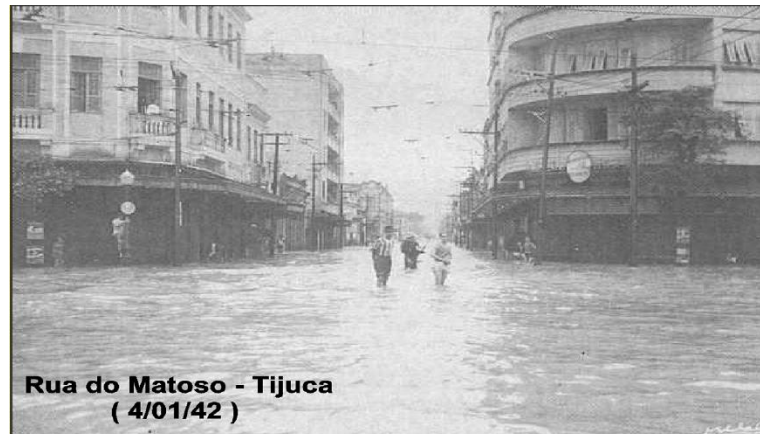
Figura 1 – Enchente na Praça da Bandeira – 04/01/1942