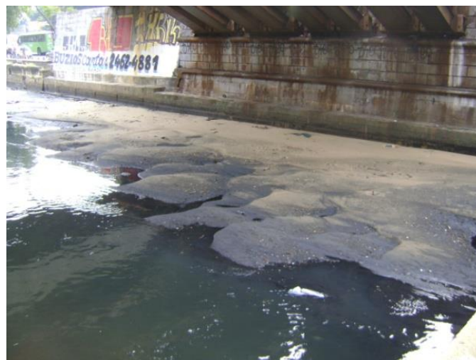
Figura 7 – Assoreamento de calha no Canal do Mangue