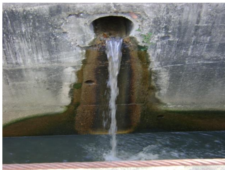
Figura 4 – Ponto de entrada de esgoto bruto no rio Joana