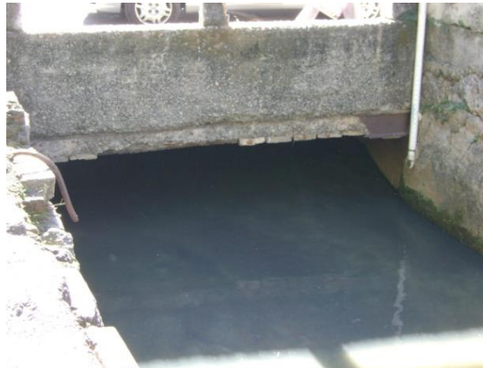
Figura 6 – Obstrução do escoamento da seção maior do rio Trapicheiros por viga de ponte