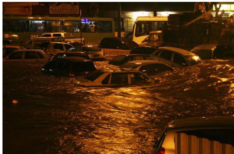
Figura 2 – Enchente na Praça da Bandeira – 05/04/2010