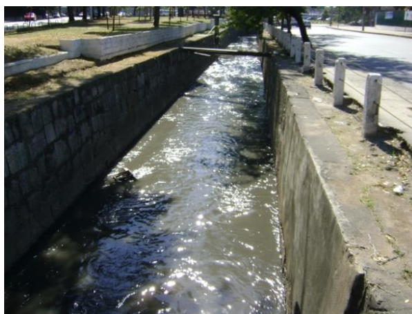
Figura 5 – Água poluída do rio Joana