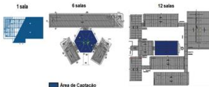
Figura 2 - Área de Captação por tipologia predial para Recife.