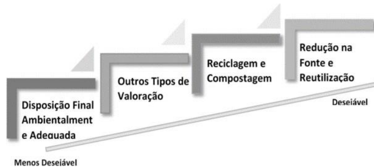
Figura 2- Hierarquia do Resíduos Sólidos da União Europeia.